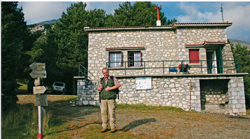
An der EOS-Schutzhütte Agia Varvara.

schen Golf führt. Bis zur EOS-Schutzhütte Agia Varvara (4) in 1550 m Höhe sind es nun nur noch knapp 200 m.