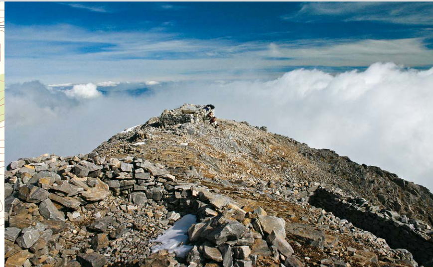
Auf dem Gipfel des höchsten Berges des Peloponnes.

Wir steigen durch lichter werdenden Wald weiter stetig aufwärts und stoßen schließlich auf den von Anavryti kommenden Europäischen Fernwanderweg E4 (3) , 1471 m. Hier halten wir uns links und erreichen nach knapp 500 m die Quelle Varvara. Sie bietet die letzte Möglichkeit, an Wasser zu kommen. Wir setzen unseren Weg fort und gelangen nach wenigen Minuten erneut an die vom Parkplatz kommende Staubstraße. Hier verlassen wir den E4, gehen rechts und wandern nun für einige Zeit auf dem Nationalen Fernwanderweg 32, der von hier durch die Viros-Schlucht nach Kardamyli am Messeni-