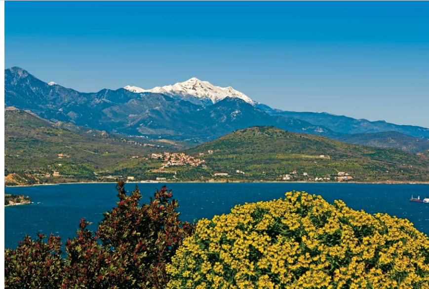
Der schneebedeckte Profitis Ilias liegt etwa 35 km Luftlinie vom Dorf Skoutari entfernt.

2. Die EOS-Schutzhütte mit Schlafmöglichkeiten für 20 Personen ist normalerweise verschlossen, wird nach telefonischer Absprache (+30 27310 22547 oder +30 27310 22983) aber geöffnet. Bedenken sollte man, dass der Mindestpreis für eine Nacht 80 € beträgt. Ist die Hütte offen und sind nicht alle Plätze belegt, ist die Chance groß, dass man zur Übernachtung eingeladen wird. Eine Garantie gibt es aber nicht.