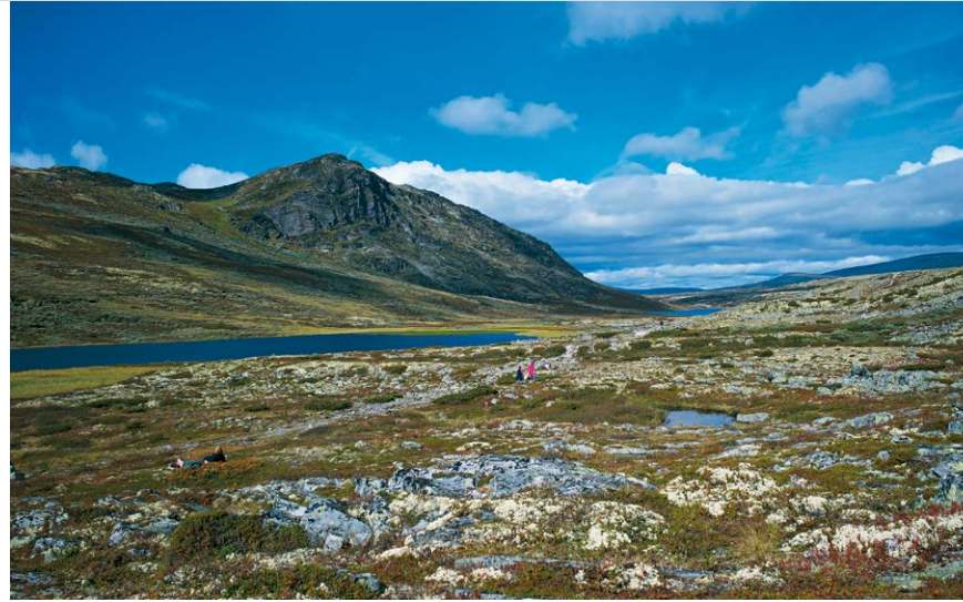
Am oberen Høvringsvatnet mit Blick zum Baksidevassberget.