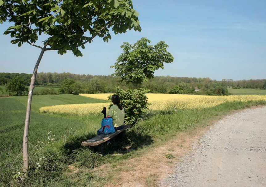
Am höchsten Punkt der Tour, bald nach Capelle.

bergab, bis wir bei den Höfen von Altfeld rechts in den Weg Zum Hirschpark einschwenken – hier steht an einem großen Steinkreuz auch eine einladende Bank. Das X leitet uns nun erst am Waldrand entlang, dann auf geschottertem Weg in den Forst, wo wir nach rund 200 m an der Gabelung (nun auch mit A 5) links weiterwandern und nach wiederum etwa 200 m der Biegung nach rechts folgen. Vom Waldrand stets geradeaus durch den Wald, auf einem Holzbrückchen über den Bach und schließlich am Waldrand bis zur L 810, die wir überqueren, um zum prächtigen Schloss Nordkirchen zu gelangen. Am Pfortnertor vorbei geht es in den Schlossbereich, wo wir X verlassen. Wir nehmen sofort rechts den Parkweg, auf dem wir das Schloss und einige wunderschöne Teiche im Linksbogen umrunden und links über die Brücke in den Bereich des Innenhofes gelangen. Vom großen Vorplatz gehen wir auf dem breiten Hauptweg durch torartige Säulen wieder vom Schloss weg und wandern geradeaus weiter auf schnurgerader, geschotterter Eichenallee; unsere Markierung ist jetzt bis auf Weiteres das Schloss (hier auch A 3, A 4 und A 6). Weiter durch den Wald (Tiergarten), bis wir schließlich durch ein Tor das Gelände verlassen. Gleich darauf stoßen wir erneut auf die L 810: ganz kurz links, die Straße überqueren und geradeaus dem Grothüser Weg nach, um vor dem wunderschönen Hof (Kras-