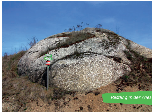
Restling in der Wiese