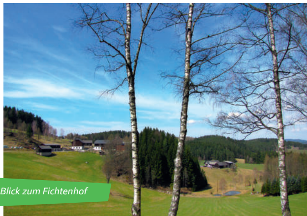
Blick zum Fichtenhof