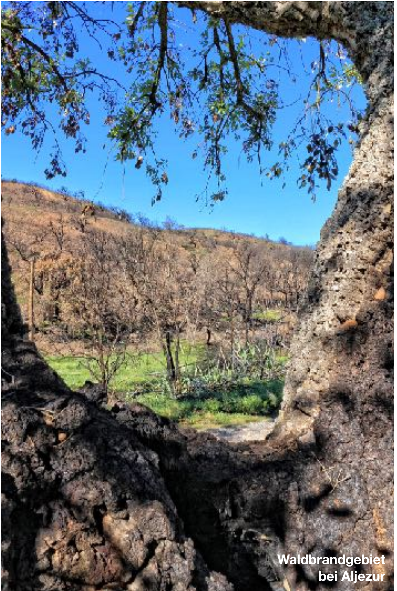
Waldbrandgebiet bei Aljezur