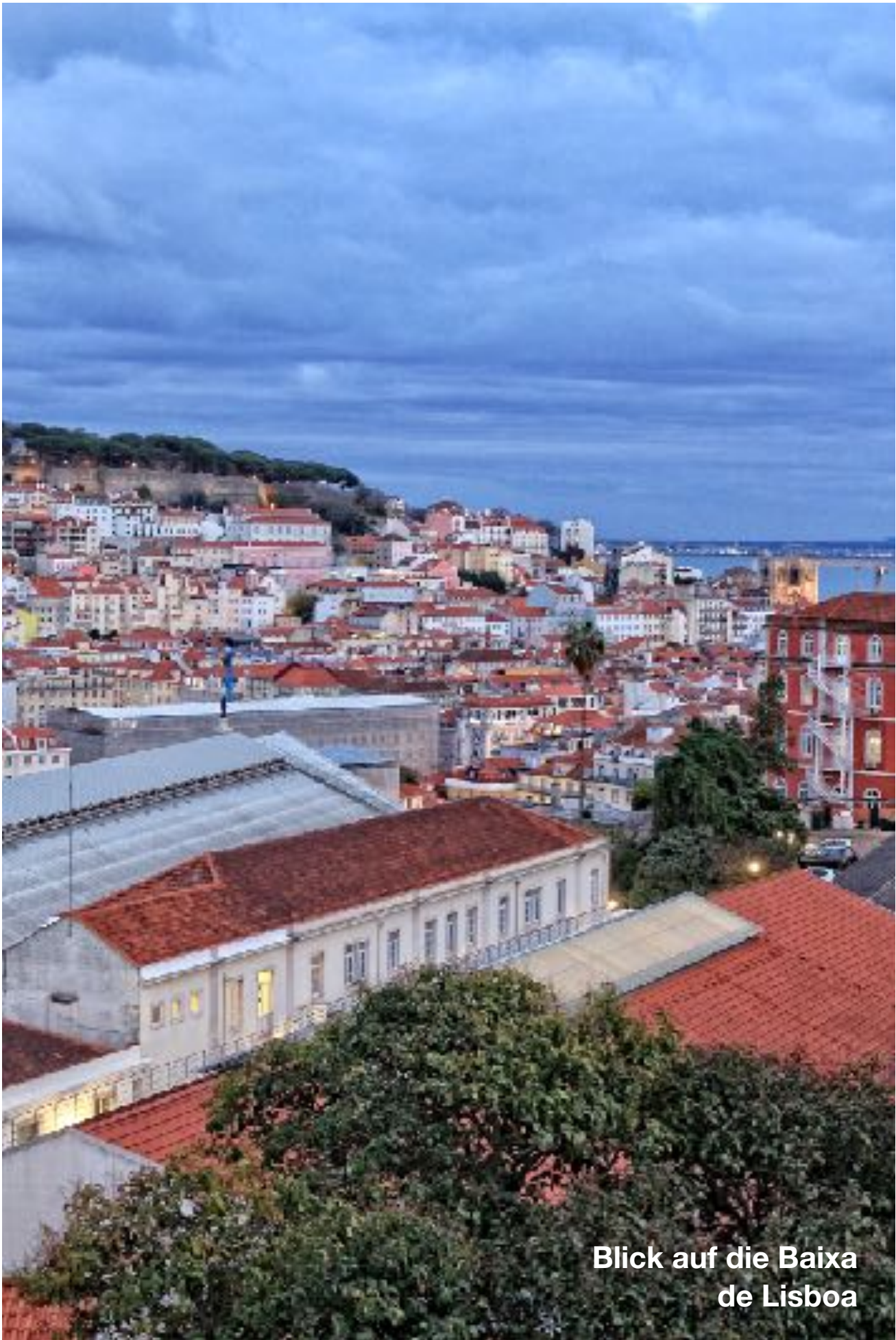
Blick auf die Baixa de Lisboa