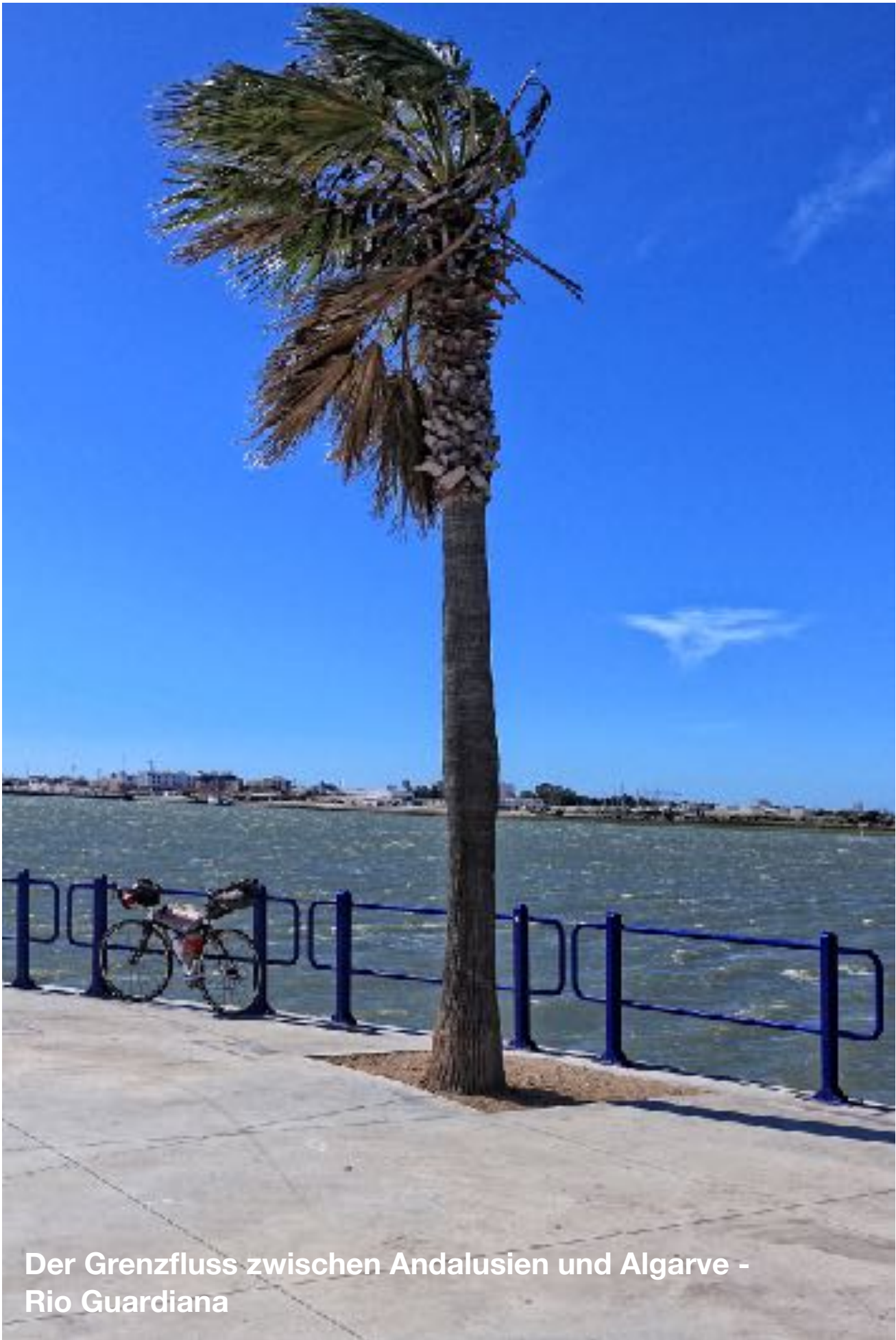
Der Grenzfluss zwischen Andalusien und Algarve - Rio Guardiana