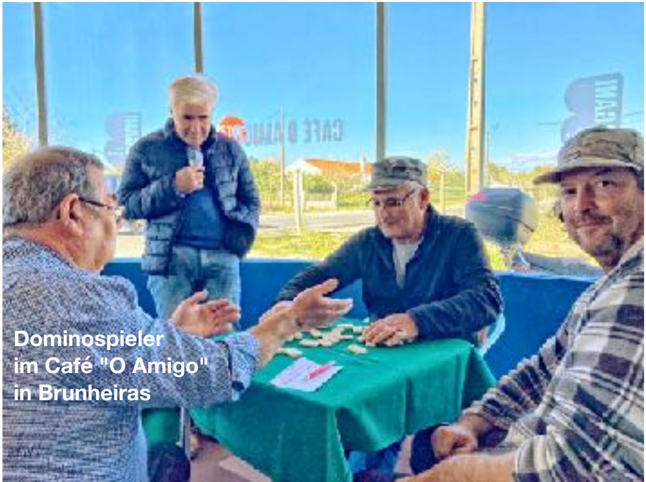
Dominospieler im Café "O Amigo" in Brunheiras

Nach gut 120 km war ich froh, in der Hafenstadt Sines einzutreffen. Hier glänzte man nicht mit Traumstränden, pittoresker Altstadt oder breiten Promenaden. Hier gibt es Fischerei, Containerschiffe, Kraftwerke und einen Hafen samt nagelneuem Flüssiggasterminal. So verdient man Geld im Alentejo. Ich war ganz überrascht, wie ich voran kam. Auf der Karte konnte man sehen, dass schon ein gutes Stück geschafft war und als nächstes wollte ich immerhin in Lissabon ankommen. Bei Vila Nova de Santo André säumten eigenartig angesengte Bäume die Straße. Ich wunderte mich und dann erkannte ich etwas, das wir vor 50 Jahren im Schulunterricht erwähnt hatten: Korkeichen. Die Stämme waren nicht verbrannt sondern geschält. Das ist das Tolle an so einer Reise in langsamer Geschwindigkeit: man bekommt alles mit und erkennt auch ohne Google-Handy, was die Welt ausmacht - die echte Welt.