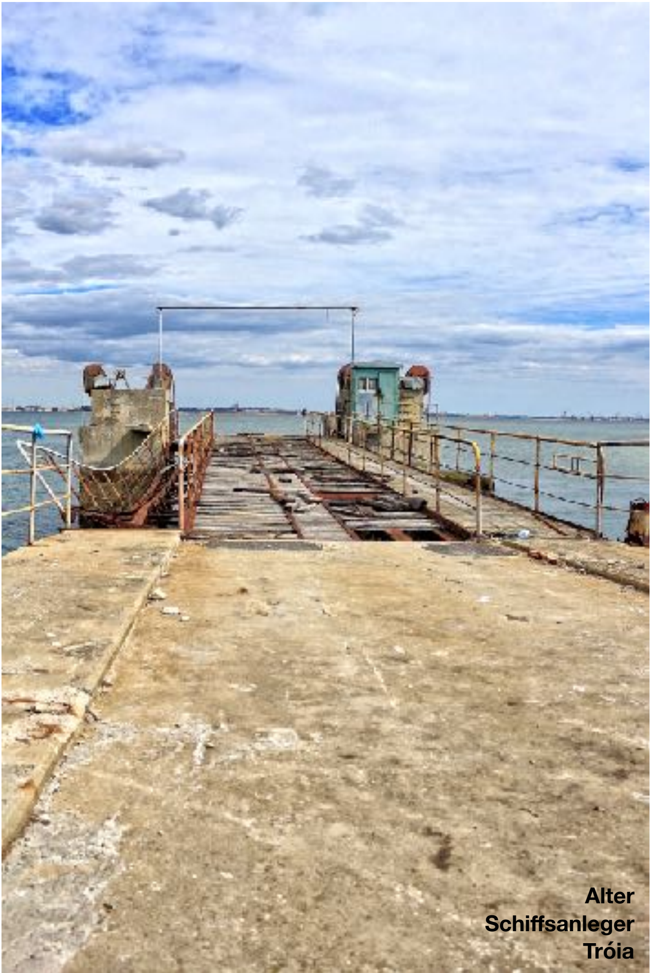
Alter Schiffsanleger Tróia