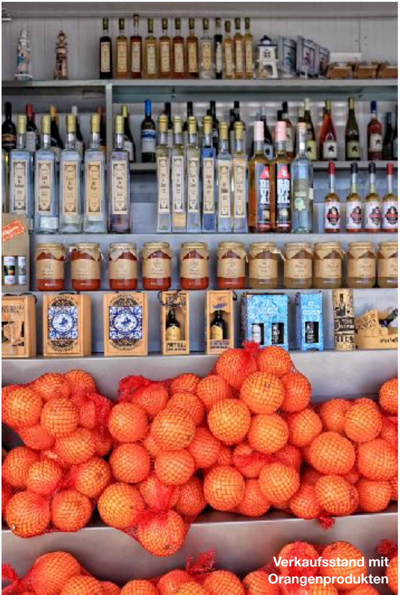
Verkaufsstand mit Orangenprodukten