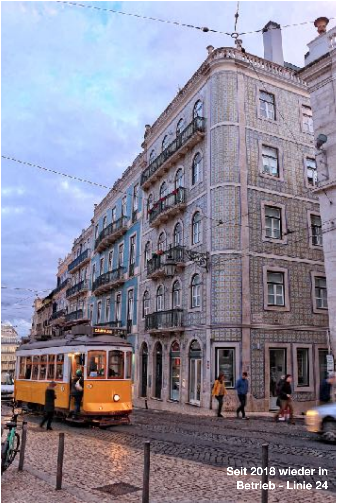
Seit 2018 wieder in Betrieb - Linie 24