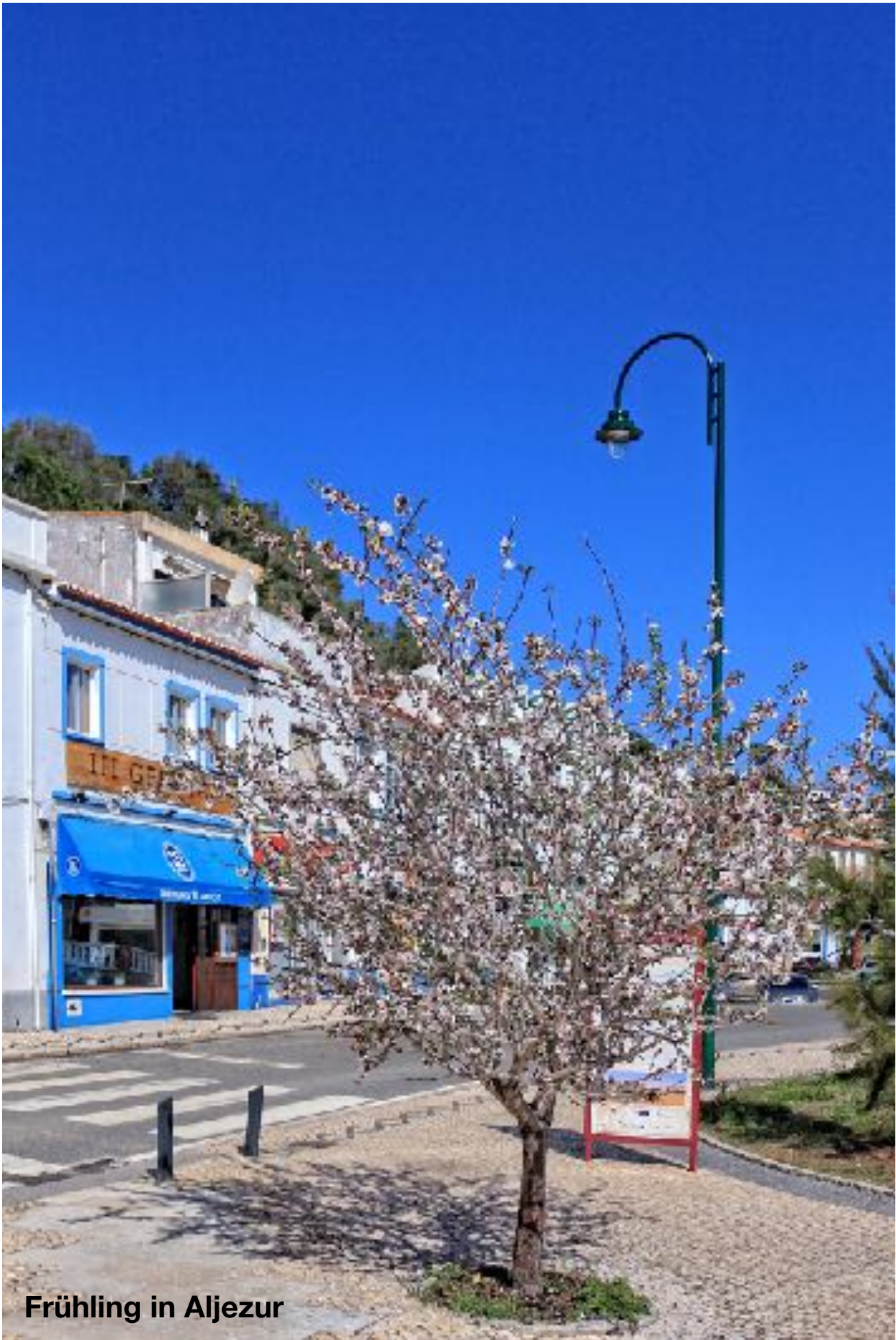
Frühling in Aljezur