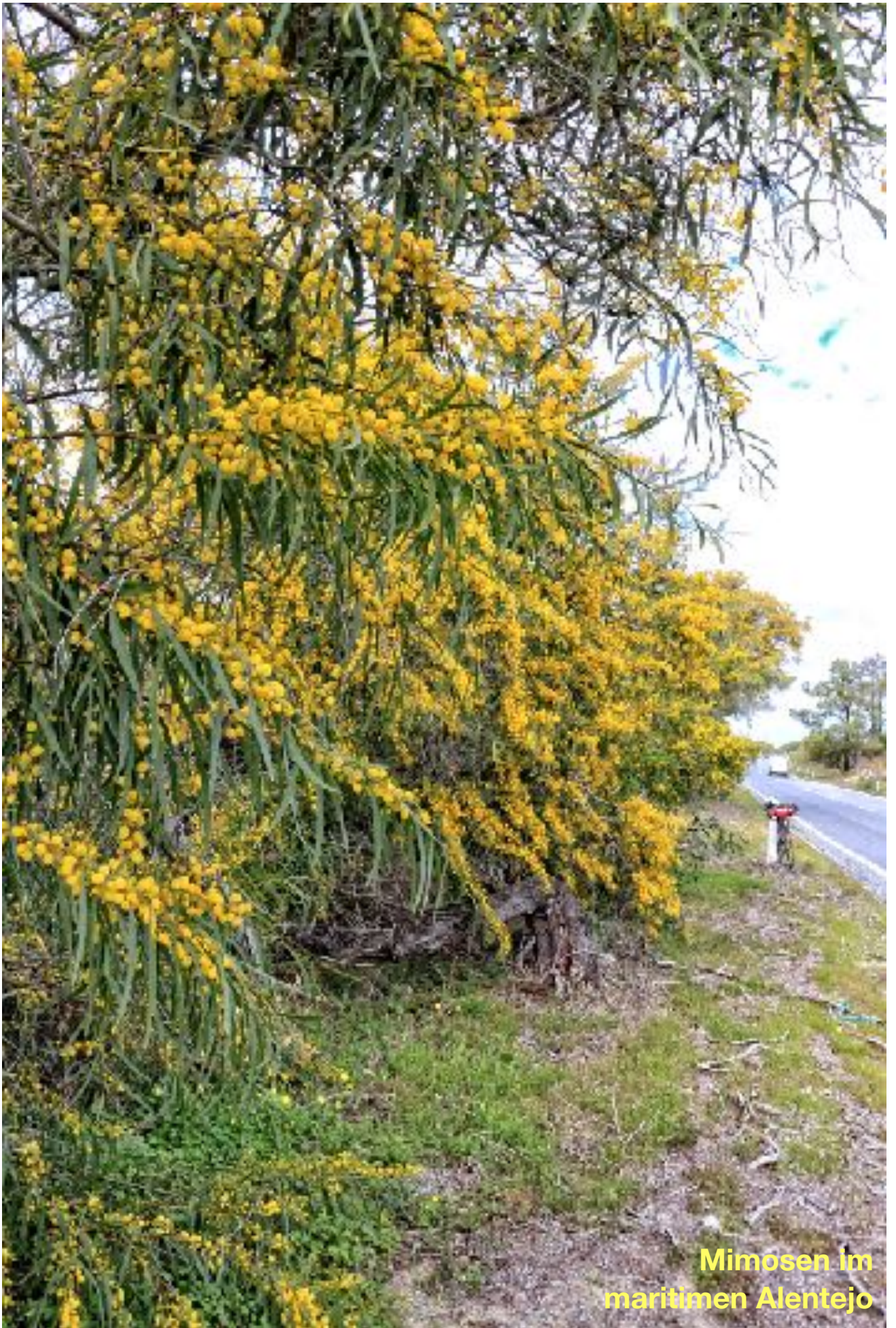
Mimosen im maritimen Alentejo