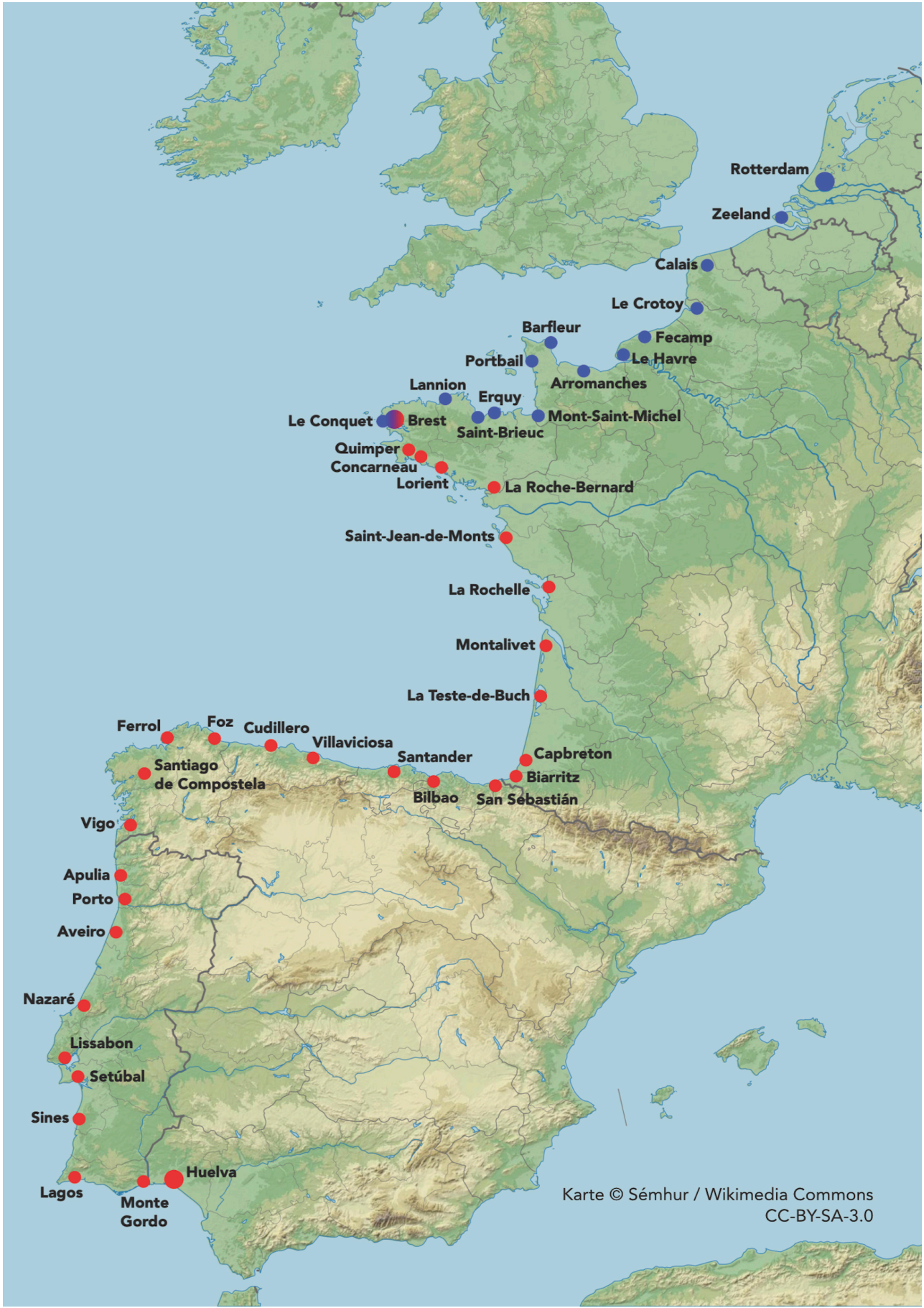
Karte © Sémhur / Wikimedia Commons CC-BY-SA-3.0