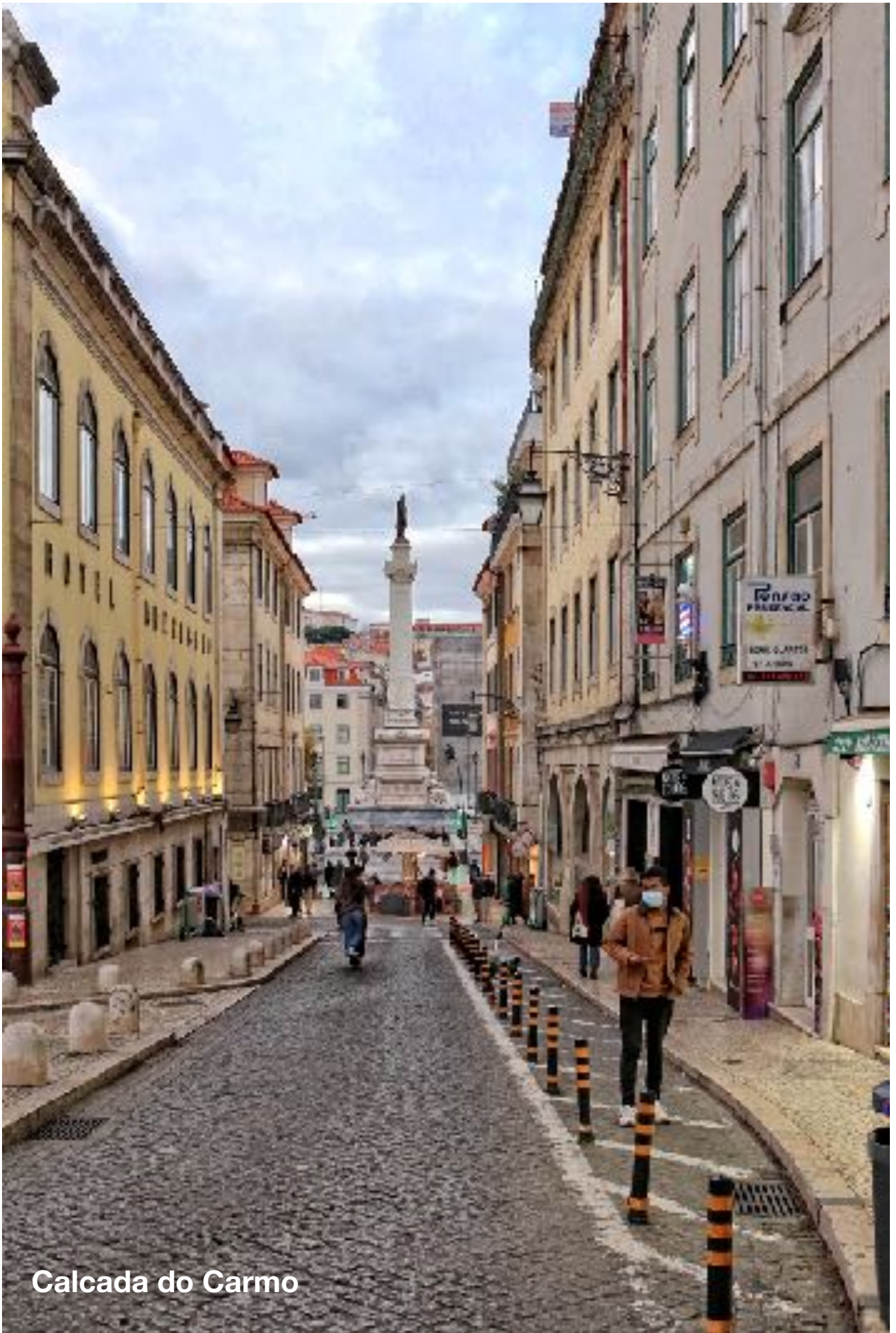
Calcada do Carmo