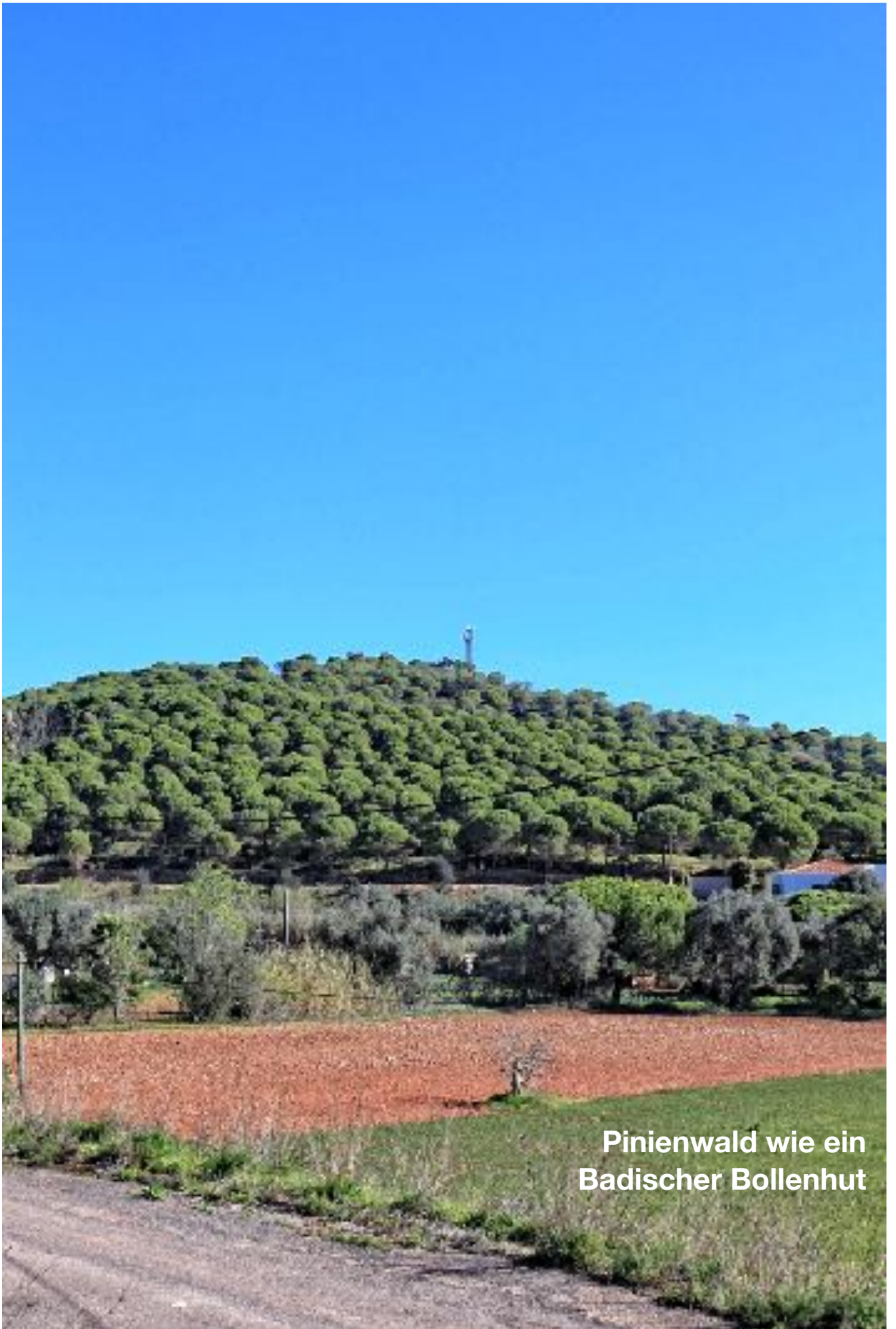
Pinienwald wie ein Badischer Bollenhut