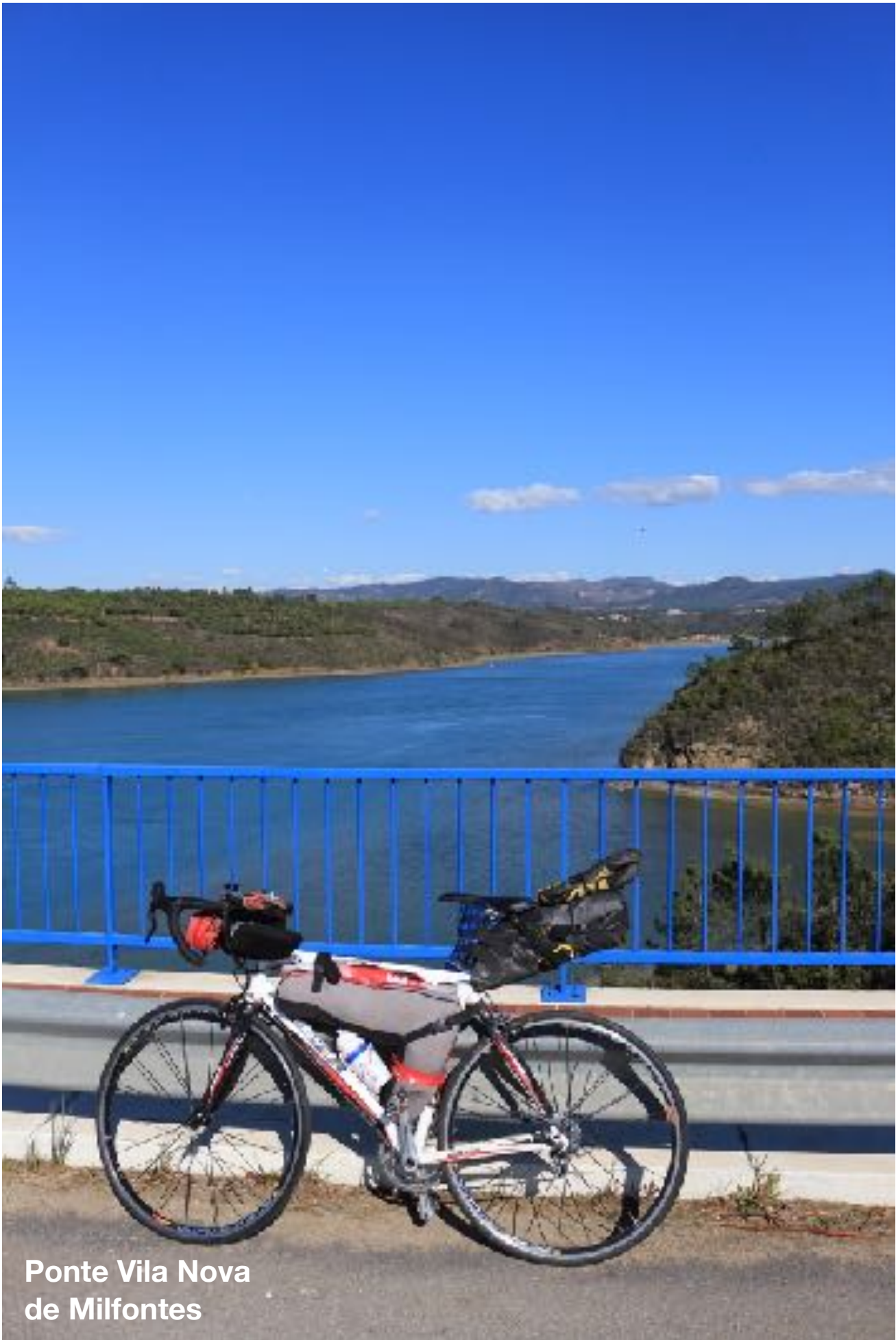
Ponte Vila Nova de Milfontes