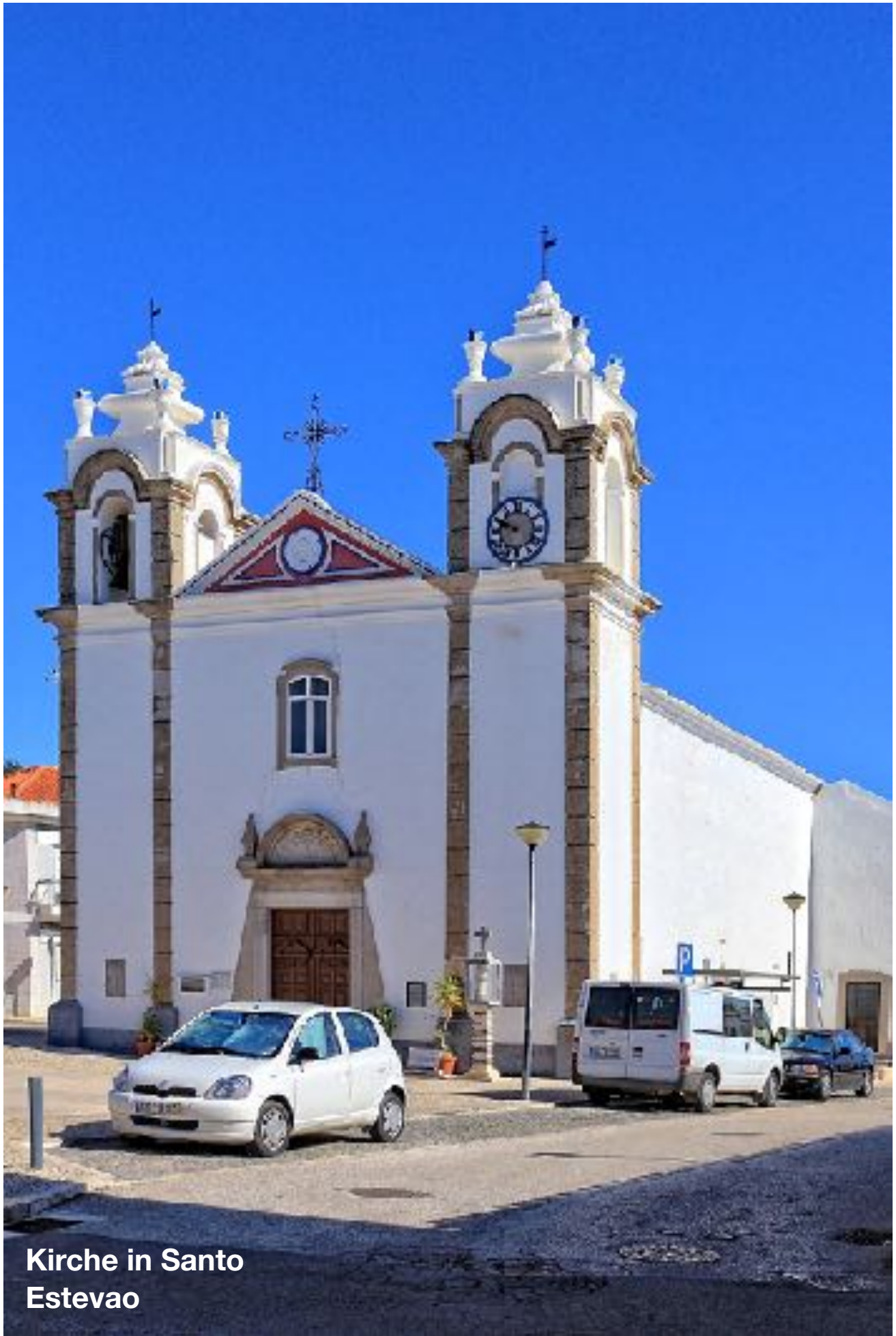
Kirche in Santo Estevao