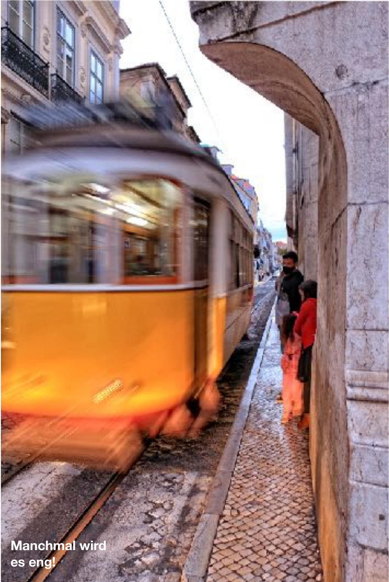
Manchmal wird es eng!