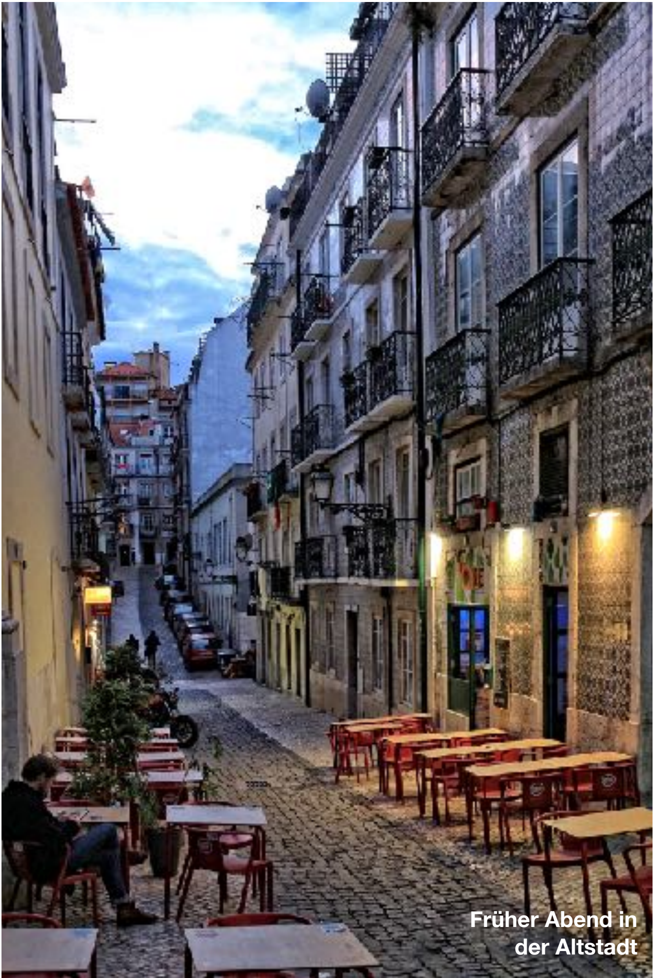
Früher Abend in der Altstadt