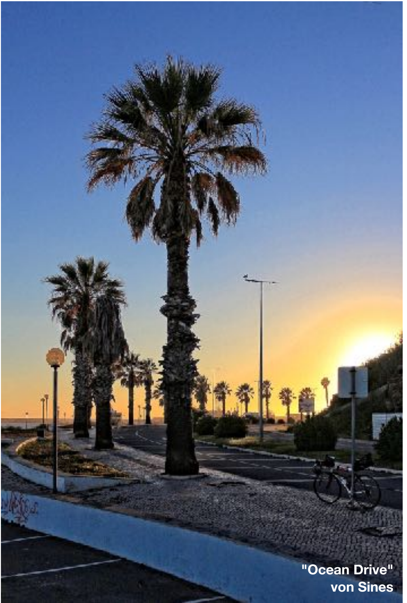
"Ocean Drive" von Sines