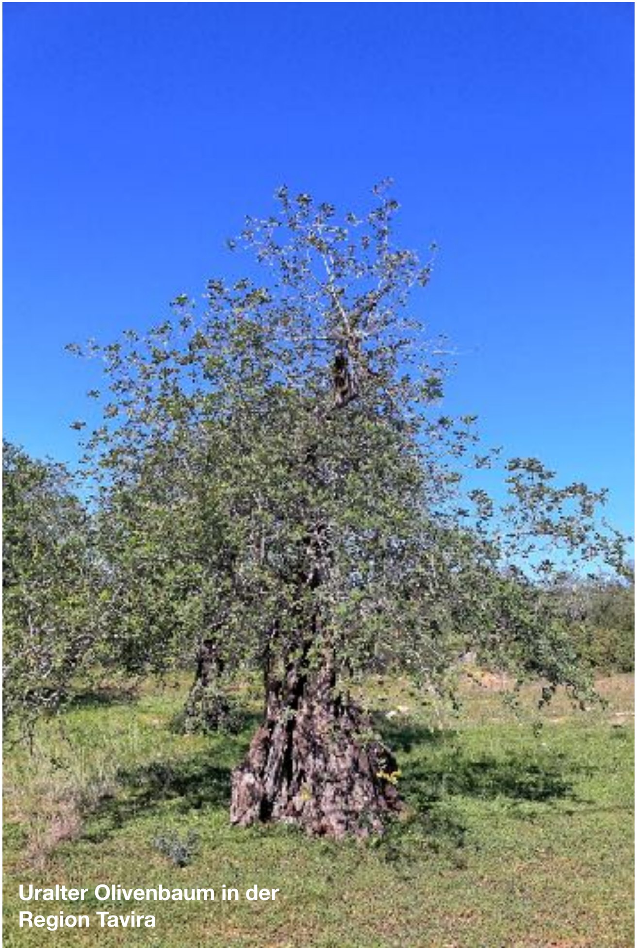
Uralter Olivenbaum in der Region Tavira