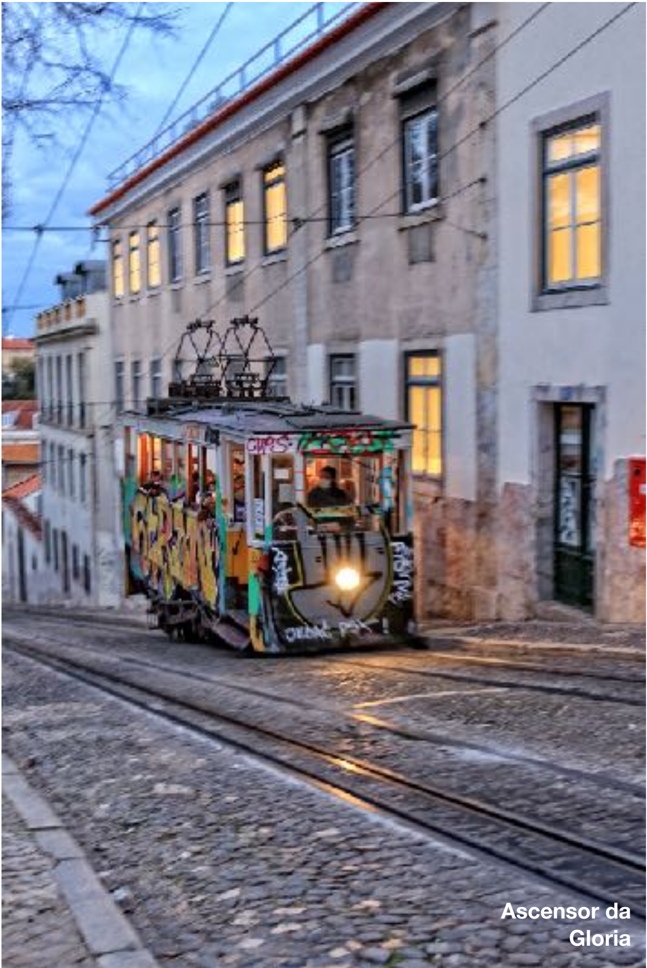
Ascensor da Gloria