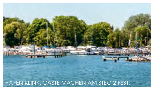
HAFEN KLINK: GÄSTE MACHEN AM STEG 2 FEST.