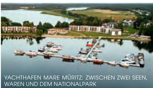
YACHTHAFFEN MARE MÜRITZ: ZWISCHEN ZWEI SEEN, WAREN UND DEM NATIONALPARK

Falls Sie nach dem Weg fragen: Müritz-zeum spricht man Müritz-e-um aus, nicht Müritz-eum. Wenn man jedoch erst mal da ist (vom Stadthafen ist es nur ein kleiner Spaziergang am Wasser entlang Richtung Steinmole) kann man im wahrsten Sinne des Wortes in die Natur der Müritz eintauchen. Zum Beispiel ein U-Boot mit Kamera durch einen echten See fernsteuern oder mit ferngesteuerten Bötchen auf einer Mini-Seenplatte herumkurven und viele Dinge anfassen, ausprobieren, angucken und anhören. Im Grunde ist das Müritzzeum ein gelungenes Beispiel dafür, wie man die Natur mit Untertiteln versieht. Hier bekommt das, was man vom Boot aus sieht, einen Namen und was man gehört hat, auch ein Gesicht wie die Vogelstimmen-Erkennungs-Wand zeigt. Idealer Landgang für Familien. (0 39 91) 63 36 80