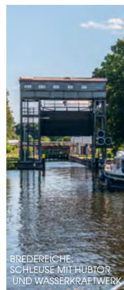
BREDERICHE: SCHLEUSE MIT HUBTOR UND WASSERKRAFTWERK

Ab Fürstenberg fließt die Obere Havel zunächst noch durch zwei schöne Seen, dann windet sie sich in sanften Biegungen durch Naturschutzgebiete, ausgedehnte Wälder und Äcker, bis sie die Schorfheide erreicht, ein besonders urwüchsiges Sumpf- und Waldgebiet mit Hochmooren und anderen Feuchtbiosphären. Im gleichnamigen Biosphärenreservat brüten sogar Kraniche und Graugänse. Bis Zehdenick folgt man noch dem krummen Flusslauf der Havel. Der Landschaft hat ihre frühere Funktion als Baustofflieferant für Berlin bis hierher nicht geschadet. Aus den ehemaligen Tonstichen sind beiderseits der Wasserstraße idyllische Naturreservate für Pflanzen und Tiere geworden. Ab Zehdenick zu Tal ist die obere Havel jedoch kanalisiert. Die glorreiche Vergangenheit kann kaum über die funktionelle Optik hinwegtrösten: An diesem Stück Kanal wurde fast 200 Jahre lang ständig gebaut.