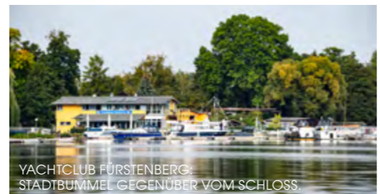
YACHTCLUB FÜRSTENBERG: STADTBUMMEL GEGENÜBER VOM SCHLOSS

Lage: 0,3 km 0,3 km 0,3 km Unter den Linden 5, 16798 Fürstenberg (01 73) 9 10 33 08 bootswerft-palm@t-online.de bootswerft-palm.de