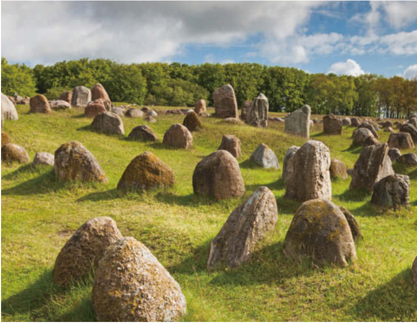
Lindholm Høje ist Dänemarks größtes Gräberfeld aus der Eisen- und Wikingerzeit