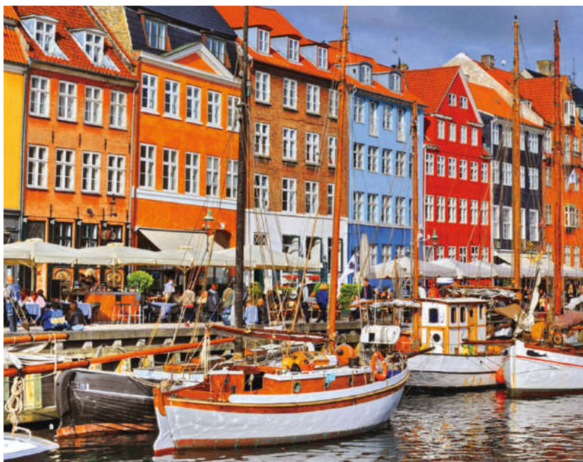
Zahlreiche Cafés und bunte Häuser säumen den Kopenhagener Kanal Nyhavn

Im Königreich Dänemark finden sowohl Familien mit Kindern als auch Kulturinteressierte ihr ideales Reiseland