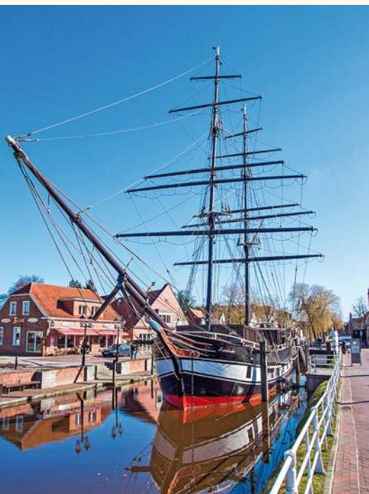
Die Brigg »Friederike von Papenburg« auf dem Papenburger Hauptkanal wurde zum Wahrzeichen der Stadt.

Forschungsschiffe, Gastanker und Tiertransporter. Die Führungen (ca. 2 Std.) finden ganzjährig und nach vorheriger Anmeldung bei Papenburg Tourismus statt. In den Sommerferien (Juli) werden jeden Sonntag um 10 Uhr auch spezielle Familienführungen angeboten. Auf Kinder warten richtige Werftarbeiter-Jacken, kindgerechte Erläuterungen und die ein oder andere Überraschung.