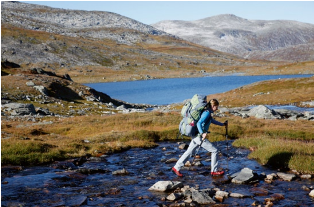
Angenehmer Nebeneffekt von Touren im Herbst: Die Wasserstände sind niedrig.

greifen die Trekkingstöcke und wandern am Bortistu Gjestagard vorbei in den Birkenwald, der sich den Nordhang des Tals hinaufzieht. Es ist ein wenig schwer, den besten Weg vom Hof in den Wald zu finden, weil es mehrere Möglichkeiten gibt, es lohnt sich daher, einen der Flyer der Farm vom Parkplatz mitzunehmen. Als grober Richtungsweiser gilt: an den letzten Häusern Richtung Nordwesten. In dieser Richtung liegt, wenn auch zwei Tagesmärsche entfernt, die Trollheimshytta. Sonnenstrahlen fallen durchs bunte Blätterdach auf den Pfad. Angesichts der Windstille und Sonne wird uns richtig warm, so dass wir es fast bereuen, keine kurzen Hosen für unsere Herbsttour eingepackt zu haben. Bald erreichen wir einen kleinen Bach, der in einer Rinne ins Tal fließt. An seinem östlichen Ufer steigen