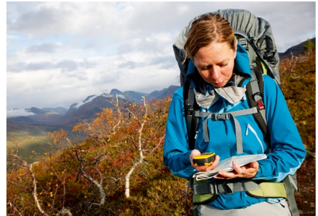
Wunderbare, wilde Weite – Eine traumhaft schöne Tour im Trollheimen (Tour 6) Nicht zwingend notwendig, aber interessant, um die eigene Route zu verfolgen: Ein GPS als Ergänzung zur Karte.