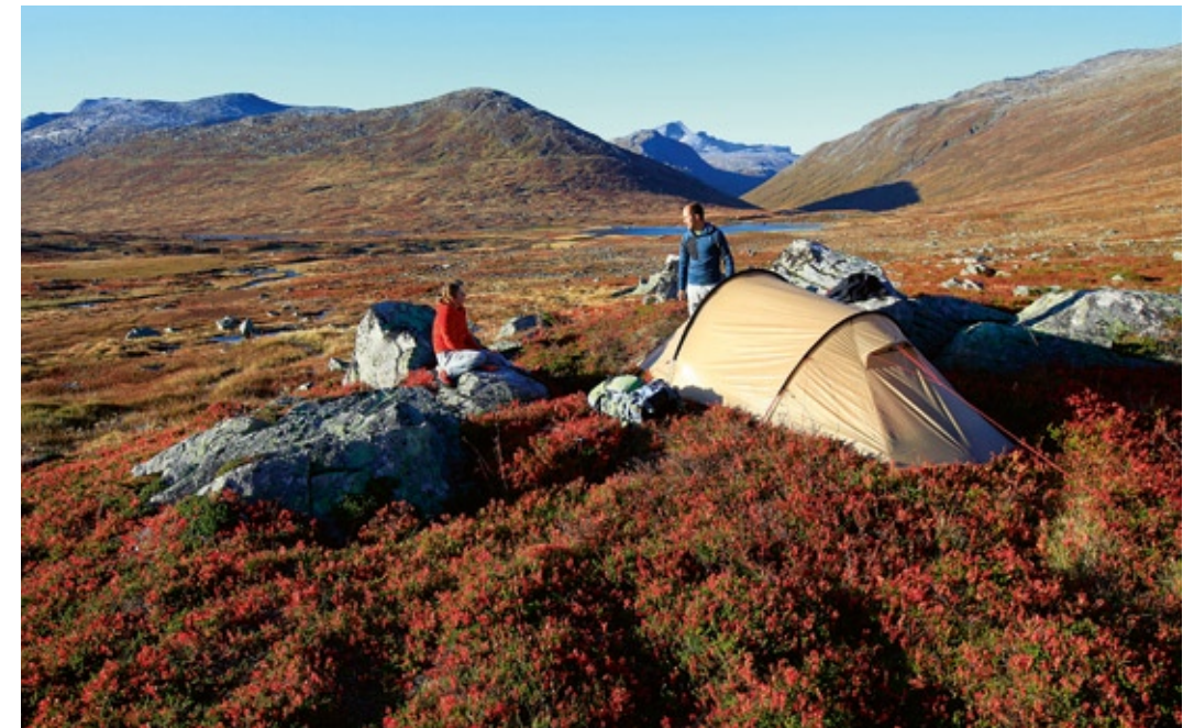
Wilder Zeltplatz im Tal der Folda am ersten Abend. Noch ist das Wetter ein Traum.

wir höher und höher, die Aussicht zurück ins Storlidalen und in Richtung Innerdalen mit seinen imposanten Bergen wird immer besser, besonders, als wir nach 250 Höhenmetern die Waldgrenze hinter uns lassen.