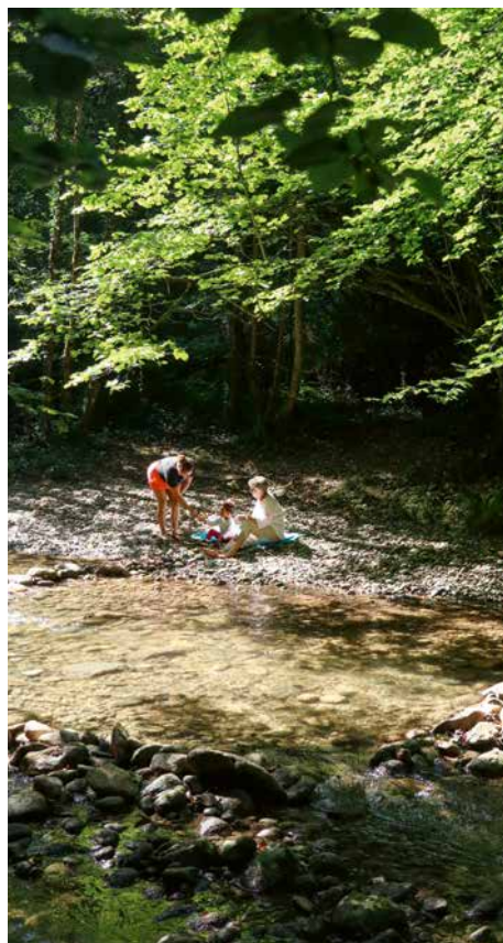
Am Veyron oberhalb der Tine de Conflens

Der seichte Bach Veyron lädt zum Planschen ein, auf schattigen kleinen Kiesbänken kann man spielen und grillieren. Ein angenehmer Ort für Familien mit kleineren Kindern. Nur 10 Gehminuten entfernt stürzen sich der Veyron und die Venoge in den grossen dschungelartigen Felsenkessel Tine de Conflens (siehe das Foto auf der folgenden Doppelseite, Sonne ca. 13–15 Uhr), dessen Name auf Deutsch «Tobel des Zusammenflusses» bedeutet. Der Zutritt zum Rand des Wasserfallbeckens ist verboten, da die Gemeinde La Sarraz Unfälle durch Steinschlag und Hochwasser befürchtet. Bei Abschluss der Recherchen zu diesem Buch war ihr allerdings kein derartiger Unfall bekannt, wie sie auf Nachfrage erklärte. Tatsächlich herrscht in der Tine de Conflens meist ein reger Badebetrieb, weil sich viele Einheimische über das Verbot hinwegsetzen.