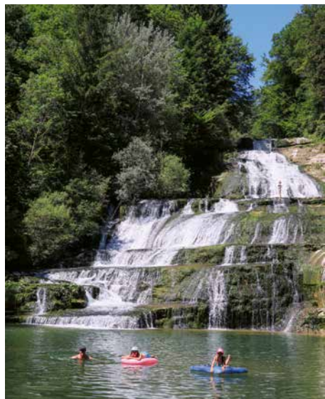
Wasserfall Saut du Day