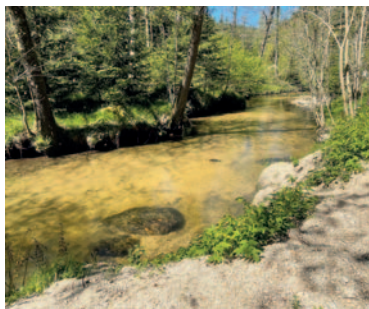
Flaches Ufer am oberen Abschnitt

Unsere Tour beginnt bei der Busstation Grein Gießenbachbrücke bzw. am Parkplatz Jausenstation Gießenbachmühle daneben. Nach dem Viadukt den Wegweisern Stillensteinklamm , später Aumühle , folgen. Wir bleiben dabei immer auf dem Weg 9 . Nach der Ankunft beim Hotel Aumühle gestärkt auf derselben Strecke zurückwandern, bis kurz nach dem Stausee . Hier zweigen wir rechts auf den Weg 9a (Klammleiten) ab. Grundsätzlich ist dieser gut markiert – bis auf eine Stelle: Hier links halten und nicht zur Bundesstraße gehen. Kurz vor dem Ziel wechseln die Wegweiser auf Stillensteinklamm Eingang (9).