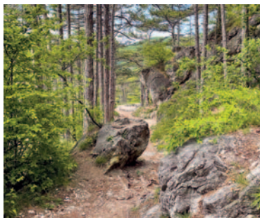
Über Stock und Stein ins Tal

chen einen Forstweg mit Schranken . Nachdem er passiert ist, geht es stets geradeaus weiter, dem Wegweiser zur Königshöhle folgend. Wir passieren die Höhle und wandern bis zu einer T-Kreuzung . Dort folgen wir dem Wegweiser Baden über Rauheneck (40) nach links und erreichen nach kurzer Zeit die Burgruine Rauheneck . Nach der Besichtigung und erneuter Überquerung des Burggrabenstegs wandern wir nach rechts bergab und bleiben stets auf dem breiteren Weg , der uns über Stock und Stein führt und schließlich in eine asphaltierte Straße übergeht. Unten angekommen sehen wir ein Marterl . Dort biegen wir links auf den Pfad, der uns wieder zur Eugenbrücke führt. Von hier aus gehen wir denselben Weg zurück bis zu unserem jeweiligen Ausgangspunkt.