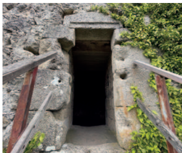
Auf in den dreieckigen Turm!

Um Rauheneck zu erkunden, passieren wir das Erholungsgebiet Holzre-