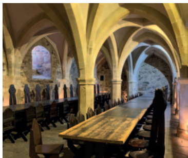
Hier haben einst Ritter getafelt!

Dafür spazieren wir entlang des Burgsees und spekulieren, wo sich der legendäre Templer-Schatz wohl verber-