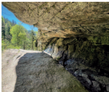
Im »Stillen Stein«