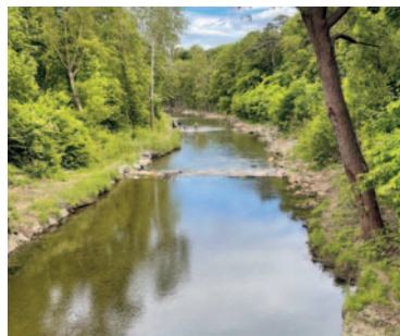
Die Schwechat lädt ein zu Wasserspielen