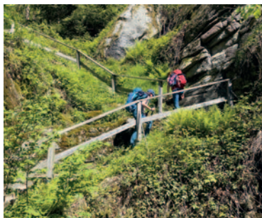
Aufstieg zum »Stillen Stein«

Neben den architektonischen Besonderheiten im Schloss ist das größte Highlight für neugierige Kinder sicherlich das Schifffahrtsmuseum. Mit liebevoll gebauten Modellen und spannenden Geschichten wird gezeigt, wie eng das Leben in Grein seit