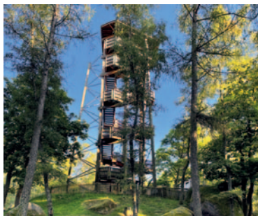
Aussichtsturm beim Schutzhaus

Nicht allzu weit vom Gasthaus zur Blockheide entfernt (etwa 250m Fußweg) können wir etwas Ungewöhnliches entdecken: Weiden , die von Wasserbüffeln bewirtschaftet werden. Die imposanten, aber sanftmütigen Tiere können dort von ca. Mai bis Oktober beim Grasens im Sumpfgebiet beobachtet werden. Tafeln zeigen euch, wo sie gerade ihre Arbeit verrichten. Einer der Eingänge befindet sich gegenüber der Großeibensteiner Straße 32 . Fast daneben ist der Parkplatz der Latschenhütte (Einkehrmöglichkeit), falls ihr mit dem Auto kommt.