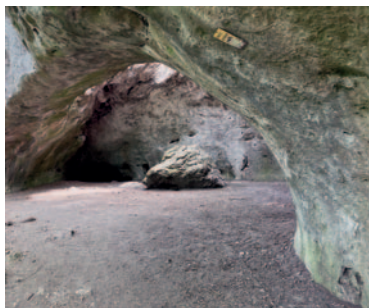
In der Königshöhle

Wie zwei wachsamen Wächter stehen sie am Eingang des Helenentals: Burg Rauhenstein auf der rechten, Burg Rauheneck auf der linken Seite der Schwechat. Im späten Mittelalter, als der Glanz der Ritter längst vergangen war, sollen sie – vom Wohlstand verlassen und auf der Suche nach Beute – eine schwere Kette zwischen den Burgen gespannt haben. So wollten sie Handelsleute an der Weiterreise hindern, um sie zu berauben. Heute noch stolz auf einer Felsklippe thronend, wurde Burg Rauheneck – die wir erkunden werden – im 12. Jahrhundert erbaut. Zerstörung und Wiederaufbau prägten ihre Geschichte, bis sie schließlich dem Zahn der Zeit erlag. Heute zählt sie zu den größten Burgruinen rund um Wien.