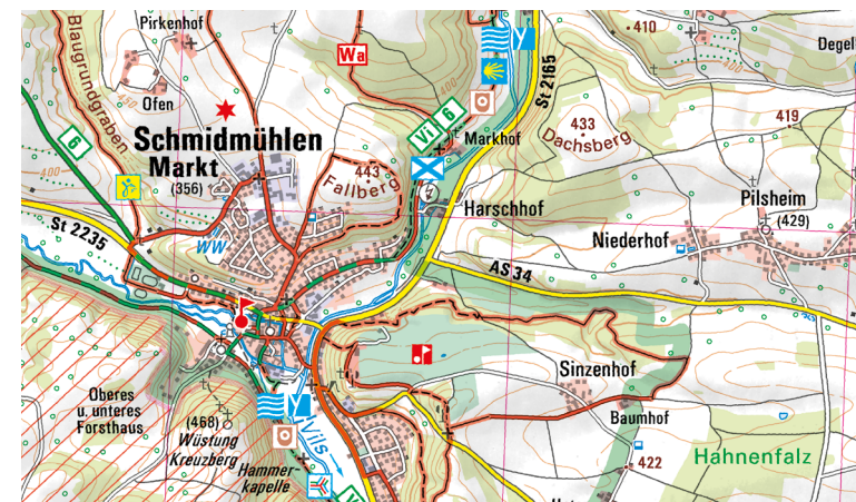
Ausschnitt aus UK50-19 Naturpark Hirschwald

Erholung und Spaß für die ganze Familie bieten die beiden Wohlfühlbäder Bulmare in Burglengenfeld und das Kurfürstenbad in Amberg. Schöne Ausflugsziele für Jedermann sind der Freizeitpark Monte Kaolino bei Hirschau, das Freilandmuseum Goglhof in Eberhardsbühl bei Edelsfeld oder das Planetarium in Ursensollen.