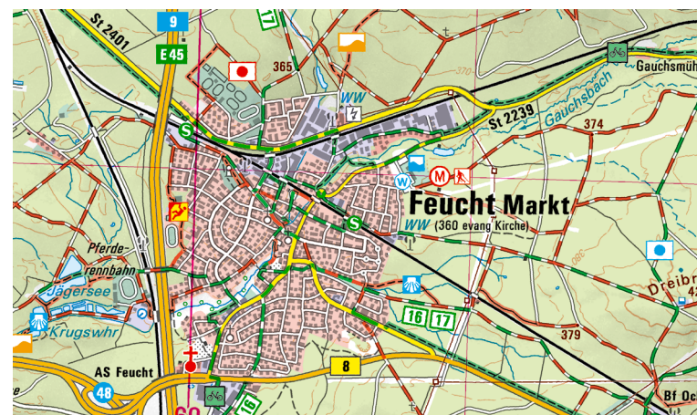
Ausschnitt aus UK50-18 Nürnberger Land – Frankenalb

Für Tierfreunde ist ein Besuch im Tiergarten Nürnberg zu empfehlen. Wer mit Kindern unterwegs ist kann im Playmobil Funpark einen schönen Tag verbringen oder in einem der vielen Bäder haltmachen. Z.B. das Thermalbad Fürthermare oder das Kristall Palm Beach mit vielen aufregenden Rutschen. Kulturinteressierte finden in der Gegend einige sehenswerte Schlösser und Ruinen wie die Burgruine Wolfstein bei Neumarkt i.d.OPf. und das Schloss Ratibor in Roth.