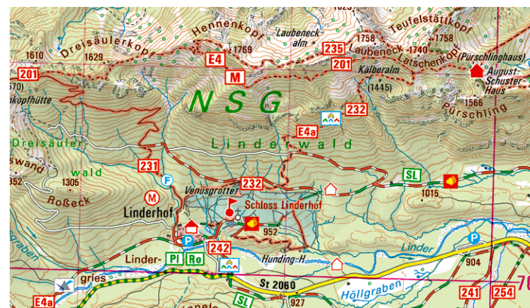
Ausschnitt aus UK50-49 Pfaffenwinkel – Ammergauer Alpen Nord

Die Klöster Wessobrunn, Polling, Steingaden oder Rottenbuch und Kirchen wie die Hohenpeißenberg sind weitere Attraktionen der Region. Ein besonderes Highlight ist die Kirche „Wies“, welche zum UNESCO-Weltkulturerbe gehört. Die mittelalterlichen Altstädte von Weilheim i.OB, Schongau und Murnau sind genauso einen Besuch wert, wie das Buchheim-Museum oder das Freilichtmuseum auf der Glentleiten. Und auch Technikfans werden im Pfaffenwinkel fündig. Für sie lohnt sich ein Besuch im Bergbaumuseum Peißenberg oder in der Erdfunkstelle Raisting.