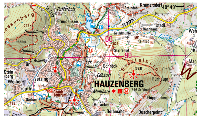
Ausschnitt aus UK50-30 Naturpark Bayerischer Wald, südlicher Teil

Am Nationalparkzentrum Lusen befindet sich das Tierfreigelände. Erleben Sie den wilden Westen in der Westernstadt Pullman City bei Eging a. See oder den Kletterwald in Waldkirchen. Ein kulturelles Highlight ist die weltgrößte Kirchenorgel im Passauer Dom. Bei Freyung befindet sich eines der schönsten Geotope Bayerns, die Buchberger Leite (Schlucht) und das Schloss Wolfstein zu besichtigen. Interessiert man sich für das historische Niederbayern geht man am Besten in das Museumsdorf bei Tittling.