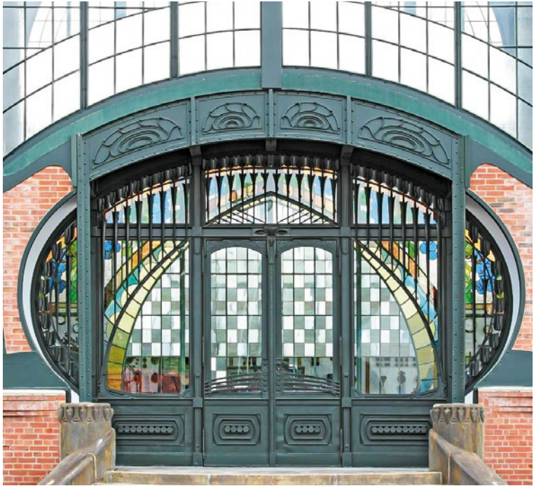
Eingangportal der Maschinenhalle

der Halle steht als Blickfang auf einem mehrstufigen Podest und ist in Marmor gefasst, Blickfang ist eine Jugendstiluhr. Zwar war Zollern als Musterzeche gedacht, es offenbarten sich im Betrieb jedoch technische Planungsmängel. So beschloss die Bergbaugesellschaft um 1930, die Zeche nicht weiter zu modernisieren, sondern im benachbarten Ortsteil Marten für einen effektiveren Abbau den neuen Zentralschacht Germania abzuteufen.