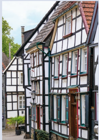
Fachwerk in Hattingen

Die Menschen im Ruhrgebiet sind sportbegeistert, für Fußball ganz besonders. In den drei Bundesligen kicken mehrere Revierclubs mit Tradition (Dortmund, Schalke, Bochum, Duisburg). Und auch in den unteren Ligen sind Woche für Woche – ob