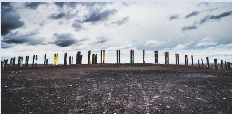
Die Installation »Totems« auf der Halde Haniel in Bottrop