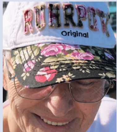
Die Menschen im Pott sind ein starkes Stück

Der Zeitungsmarkt wird dominiert von der Funke-Mediengruppe in Essen (früher WAZ-Gruppe). Fast in jeder Stadt erscheinen Lokalausgaben. Der WDR ist mit mehreren regionalen Rundfunk- und TV-Studios vertreten, zudem senden erfolgreich diverse Radio-Lokalsender. Auch viele Stadt- und Szenemagazine bereichern die regionale Medienlandschaft.