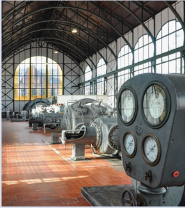
Alte Maschinenhalle der Zeche Zollern in Dortmund

in Essen oder Herne – viele Fans auf den Plätzen. Auch andere Sportarten sind beliebt wie Handball, Tennis, Leichtathletik; Olympia im Ruhrgebiet scheint möglich und wäre für viele Menschen der Region wünschenswert.