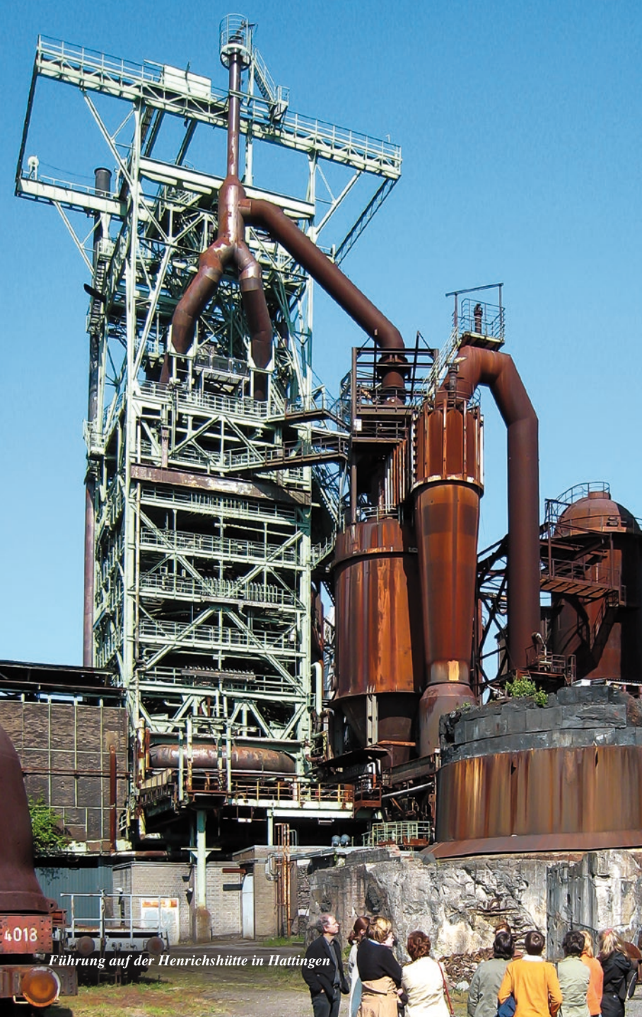
Führung auf der Henrichshütte in Hattingen