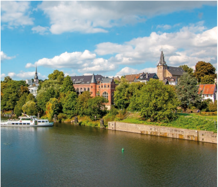
Schön grün: Essen-Kettwig