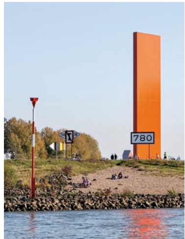
Die Skulptur Rheinorange steht an der Mündung der Ruhr in den Rhein

Duisburg selber war durch seine zentrale Lage immer so wichtig, dass bereits seit dem Mittelalter weltliche und geistliche Herrscher Interesse an diesem Ort zeigten. Das bescherte den Duisburgern im Laufe der Jahrhunderte viele Herren, denen sie dienen mussten: Duisburg war als Reichsstadt lange dem römischen Reich und damit dem Kaiser untertan, es schloss sich 1248 aus eigenem Antrieb dem Gegenkönig Wilhelm von Holland an und stand später unter der Herrschaft des Herzogs von Kleve. Der Erzbischof von Köln versuchte im Jahre 1445 während der Soester Fehde, allerdings erfolglos, Duisburg unter seine Herrschaft zu bringen, ab 1805 war es für einige Jahre französisch und gehörte ab 1816 zu