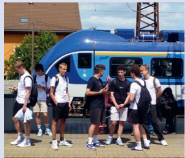
Auf dem Bahnhof in Kolín