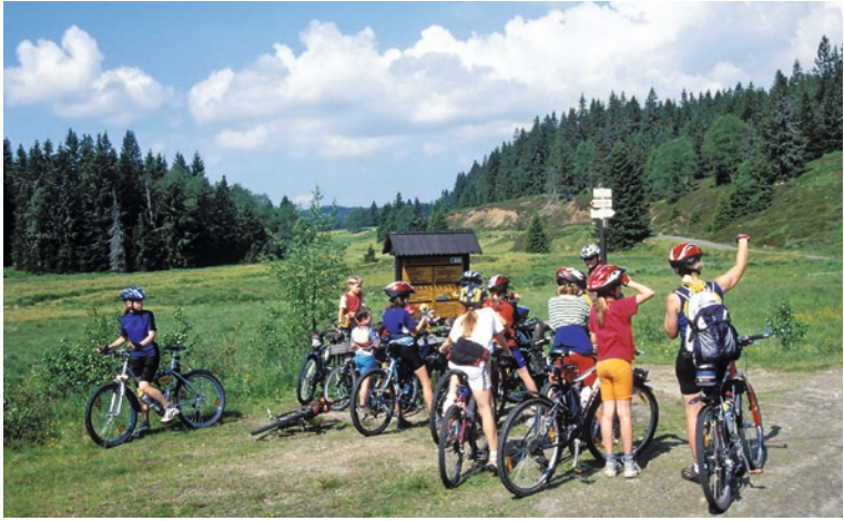
Der Böhmerwald ist ein Radlerparadies

wiesen: Böhmerwald (Šumava), Böhmisches Schweiz (České Švýcarsko), Riesengebirge (Krkonoše) und Thaya-Flusstal (Podyjí); als Landschaftsschutzgebiete: Adlergebirge (Orlické hory), Altvatergebirge (Jeseníky), Beskiden (Beskydy), Blaník, Böhmischer Karst (Český kras), Böhmisches Paradies (Český ráj), Dabaer Schweiz (Kokořínsko), Isergebirge (Jizerské hory), Kaiserwald (Slavkovský les), Lausitzer Gebirge (Lužické hory), Mährischer Karst (Moravský kras), Polauer Berge (Pálava), Pürglitzer Land (Křivoklátsko), Saarer Bergland (Žďárské vrchy), Weiße Karpaten (Bílé karpáty), Wittingauer Teichgebiet (Třeboňsko).