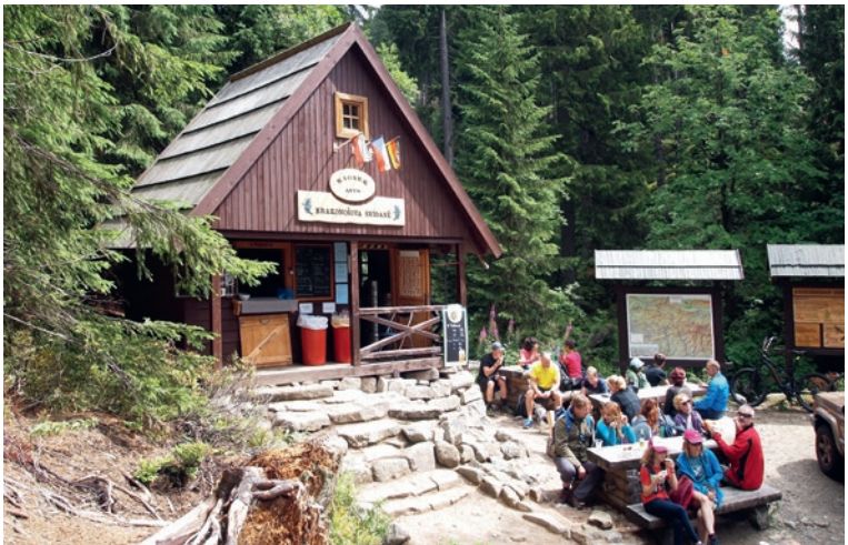
Rast an Rübzahl's Frühstückshalle im Riesengebirge

Erste Naturschutzgebiete entstanden auf dem Territorium Böhmens schon 1838 in südböhmischen Urwaldrelikten (Hojná voda, Žofínský prales) und 1858 um den Böhmerwald-Gipfel Kubany (Boubín). Als Nationalparks sind derzeit ausge-