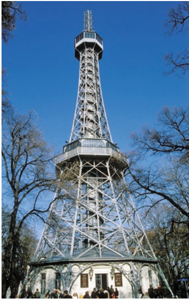
Der Aussichtsturm auf dem Laurenziberg

dominante Stadtpunkte zu sehen sind. Am schönsten ist der Blick hinüber zum Hradschin (Jan.–März u. Okt.–Dez. tgl. ab 10, April–Sept. ab 9 Uhr).