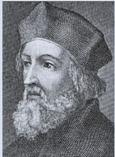
Jan Hus, Darstellung aus dem 15. Jahrhundert

1471 Nach dem Tode des letzten böhmischen Königs Georg v. Podiebrad übernimmt die polnische Jagiellonen-Dynastie das Re-