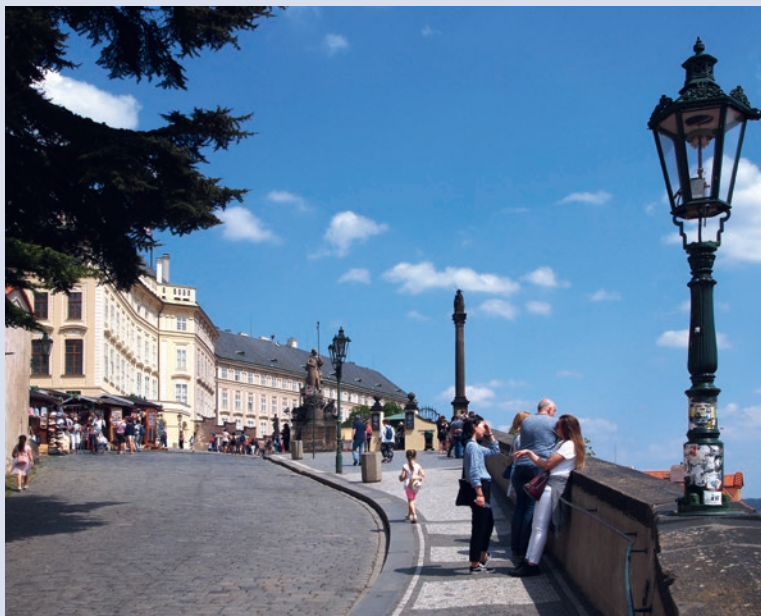
Am Aufstieg zur Prager Burg

Eine kostenlose digitale Alternative bieten das bekannte Google Maps (oder auch openstreetmaps) sowie das tschechische Pendant www.mapy.cz , wo man sich auch Wanderungen und Radtouren maßgeschneidert zusammenstellen kann.