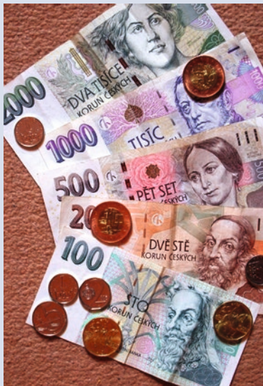
Tschechische Banknoten und Münzen

An den EU-Binnengrenzen gibt es keine regulären Grenzkontrollen. Den Personalausweis oder Reisepass muss man dennoch mitführen – es werden mitunter Stichkontrollen vorgenommen. Außerdem wird ein Ausweis an der Hotelrezeption verlangt.