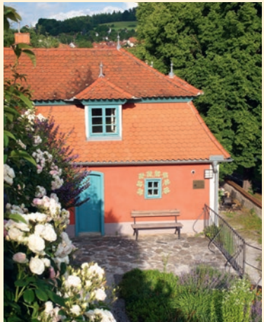
Das frühere Gartenatelier Egon Schieles