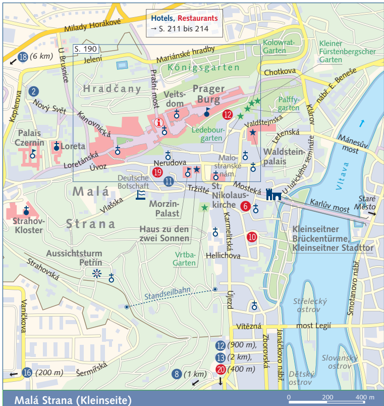
Malá Strana (Kleinseite)

Die Kleinseitner Brückentürme sowie das Kleinseitner Stadttor stehen am linken Moldauufer. Dieses gotische Stadttor von 1410 verbindet beide Türme. Darauf ist das Wappen der Prager Altstadt abgebildet. Nachdem man das Stadttor durchschritten hat, ist die Kleinseite (Malá Strana) erreicht. Der Stadtteil unter der Burg entstand als Vorort der Adligen – sie wollten in der Nähe des Burgern wohnen.