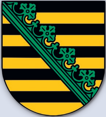
Das sächsische Landeswappen

Verwaltung: Seit 2008 bestehen die drei kreisfreien Städte Dresden, Leipzig, Chemnitz und die zehn Landkreise Bautzen,