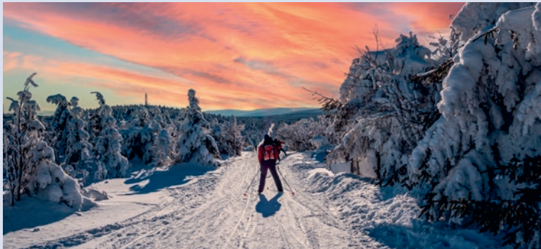
Das Erzgebirge bietet hervorragende Bedingungen für Wintersportler

In Dresden und Leipzig sind von der City Ausflugsziele und umliegende Städte wie Radebeul und Meißen von Dresden aus und Halle von Leipzig aus schnell mit der S-Bahn erreichbar. Straßenbahnen verkehren in den Städten Chemnitz, Dresden, Leipzig, Görlitz, Plauen und Zwickau.