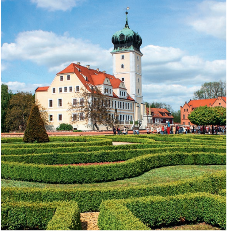
Ein wundervoller Barockgarten umspielt das Delitzscher Schloss