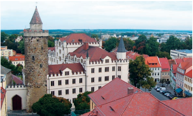
Blick vom Reichturm auf Bautzen

Erstmals 1002 ist in den Annalen eine »civitas budussin« erwähnt, 1213 erhielt Bautzen das Stadtrecht verliehen, das durch die Lage am Schnittpunkt zweier bedeutender Handelsstraßen (Halle – Breslau, Brandenburg – Prag) schon früh zu Wohlstand gelangt war. 1346 erfolgte der Zusammenschluss mit Görlitz, Löbau, Lauban (heute Lubán, Polen), Kamenz und Zittau zum Oberlausitzer Sechsstädtebund, der bis 1815 bestand. Um 1400 lag Bautzen in der Einwohnerzahl