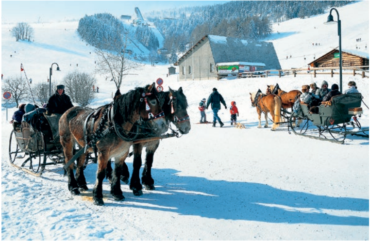
Winteridylle in Oberwiesenthal