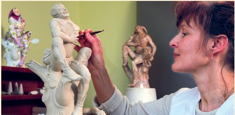
Das berühmte Meissener Porzellan entsteht in Handarbeit

Aufmerksame Leser werden sich über die unterschiedliche Schreibweise wundern, mal »Meißen« und ein andermal »Meissen«. Die Erklärung ist einfach: Der Name der Manufaktur wird mit Doppel-ss geschrieben (Meissener Porzellan), die Stadt Meißen dagegen schreibt sich mit »ß«. Beide gehören aber untrennbar zusammen. Ohne die Meissener Manufaktur würde wohl kaum einer in der Welt die Stadt Meißen kennen.