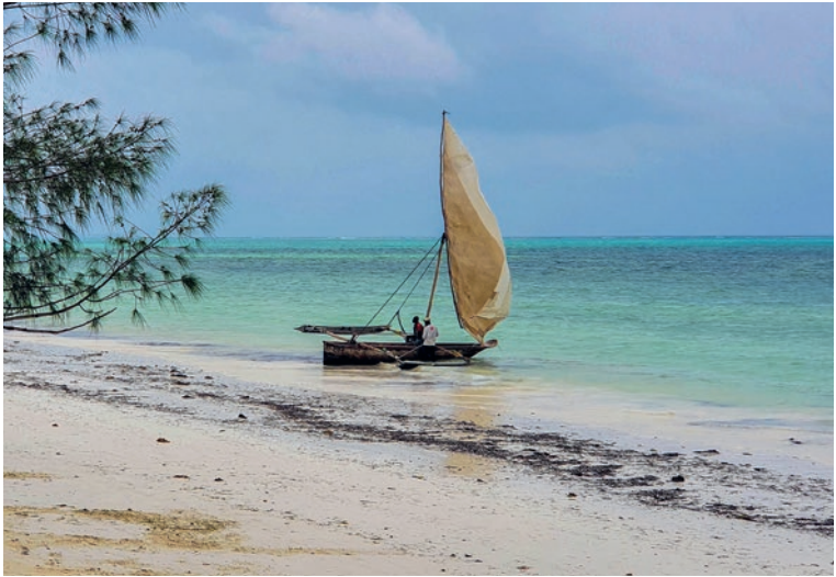
Bis heute werden die traditionellen Boote (Dhaus) zum Fischen genutzt

Herrschaft über die Swahili-Küste war relativ kurzlebig. Bis Mitte des 17. Jahrhunderts verloren sie nach dem Aufstieg des Omanischen Sultanats endgültig ihre Kontrolle über Sansibar. Die kulturellen und wirtschaftlichen Spuren, die sie hinterließen, waren begrenzt, obwohl sie neue Nutzpflanzen wie Mais, Süßkartoffeln und Ananas einführten.