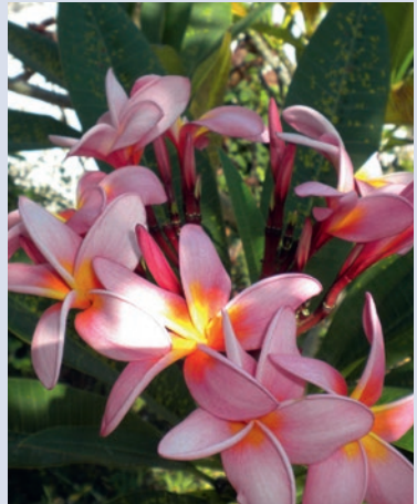
Frangipanis erfüllen die Luft mit einem besonderem Duft

Nach einer unvergesslichen Reise heißt es Abschied nehmen. Ein Transfer bringt die Gäste zurück nach Sansibar für den Weiterflug in die Heimat. Asante sana – vielen Dank für die unvergesslichen Momente!