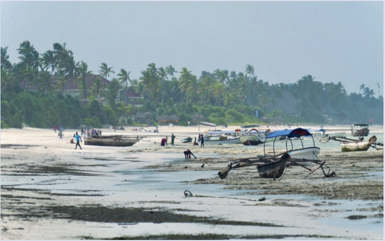
Reges Strandleben bei Ebbe