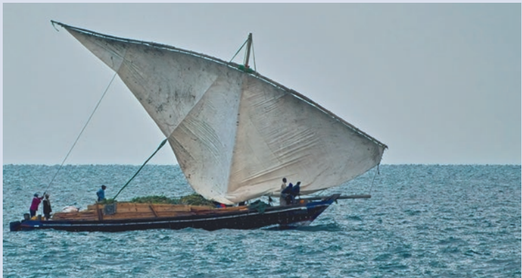
Eine voll beladene Dhau

Auch auf Mafia Island verfügt jedes größere Dorf über ein Gesundheitszentrum (zahanati), das in der Regel von einem Sanitäter oder einer Krankenschwester besetzt ist. Diese Einrichtungen erhalten