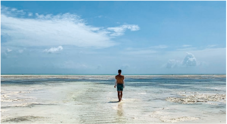
Lange Strandspaziergänge bei Ebbe

bis hin zu Restaurants, die auf Holzstelzen über dem Wasser gebaut sind, Infinity Pools, Spa- und Wellnessangebote und eine große Auswahl an Wassersportaktivitäten.