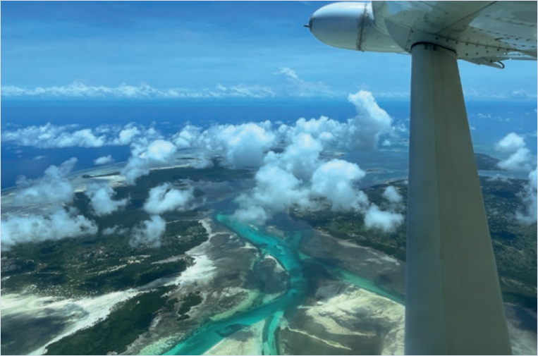
Anflug auf die Insel Pemba

Es ist ratsam, frühzeitig zu buchen und die Preise zu vergleichen, um günstige Angebote zu finden.