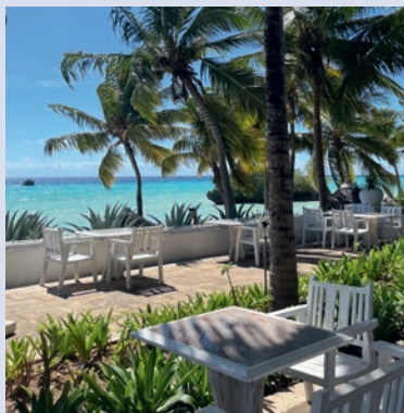
Mittagessen mit Meerblick

Übernachtung an der Südostküste: Savera Beach oder New Teddy's on the Beach