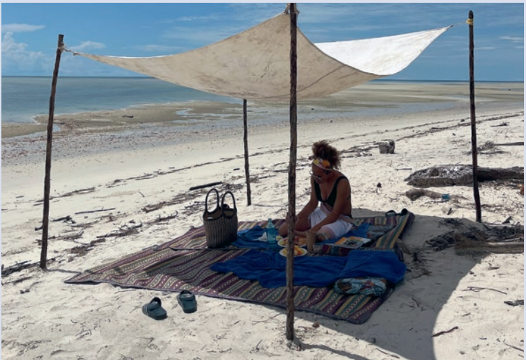
Picknick auf Mafia Island

Sansibar auf Sylt: Die bekannte Sylter Bar und Restaurantkette wurde nach Sansibar benannt.