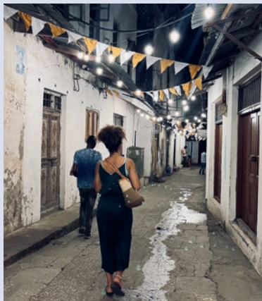
Abendspaziergang durch Stone Town

Allerdings werden einige Impfungen aus gesundheitlichen Gründen empfohlen. Dazu zählen insbesondere Schutzimpfungen gegen Hepatitis A, Typhus, Tetanus, Diphtherie und Polio. Bei längeren Aufenthalten oder besonderen Aktivitäten können auch weitere Impfungen sinnvoll sein. Für eine individuelle Beratung ist es ratsam, rechtzeitig vor der Reise einen Arzt oder ein tropenmedizinisches Institut aufzusuchen.