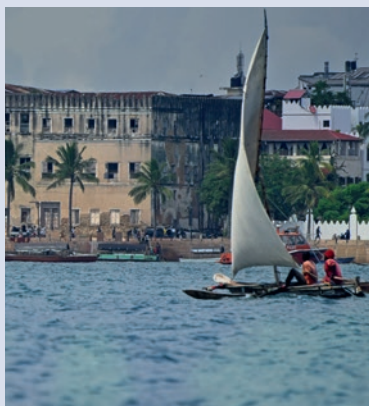
Blick auf Stone Town

Übernachtung an der Südostküste: Savera Beach oder New Teddy's on the Beach