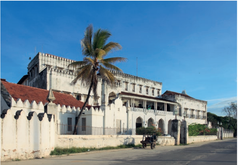
Der ehemalige Palast des Sultans von Sansibar

ten Handelsware der Insel wurden. Schätzungen zufolge wurden jährlich bis zu 60 000 Sklaven auf den Nelkenplantagen eingesetzt. Nicht ohne Grund gehörte Stone Town Mitte des 19. Jahrhunderts zu den zehn reichsten Städten der Erde. In der Folge eröffneten viele westliche Nationen Konsulate auf Sansibar, darunter die USA, Großbritannien und Frankreich. Später folgten auch Handelsniederlassungen von Belgien, den Niederlanden und Deutschland. Der erste deutsche Konsul auf Sansibar war Johann Witt, der 1860 ernannt wurde.