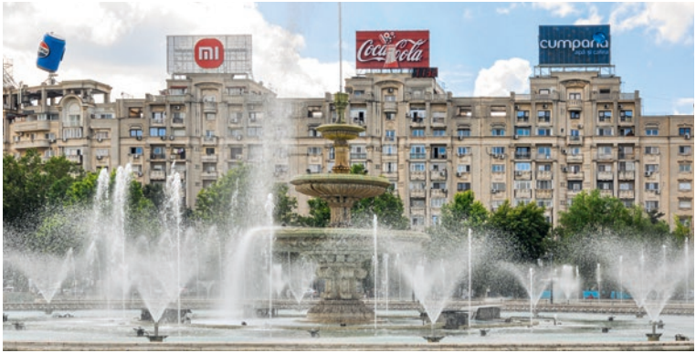
Auf der Piața Unirii

An der südlichen Seite wollte sich Elena Ceaușescu, die ebenso ungebildete wie geltungssüchtige Frau des Diktators, ein Denkmal setzen. Elena Ceaușescu, Vorsitzende der rumänischen Akademie der Wissenschaften und mit einem fingierten Dokortitel ausgestattet, ließ sich als »größte Chemikerin des Landes« und »Gelehrte von Weltruhm« feiern; der Bau sollte das Chemie-Institut werden und Elena Ceaușescu seine Direktorin. Heute ist das übergroße Gebäude Sitz der Academia Română .