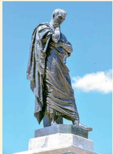
Ein nachdenklicher Ovid in Constanța

Der plausibelste Grund für die Verbannung ist politischer Art. Augustus hatte selbst keine Söhne, nur eine Tochter Julia mit seiner zweiten Frau Scribonia. Augustus' dritte Frau Livia hatte aus erster Ehe den Sohn Tiberius. Ovid lässt in der Ars amatoria eine deutliche Präferenz, was die Thronnachfolge betrifft, für Caius Caesar erkennen, Sohn der Scribonia. Dieser starb plötzlich, und man nimmt an, dass er auf Geheiß von Livia vergiftet wurde, damit Tiberius die Thronnachfolge antreten konnte. Ovid hatte auf das falsche Pferd gesetzt, wusste wohl zu viel und wurde daher von Augustus verbannt – auf Drängen von Livia, die einen starken Einfluss auf ihren Mann