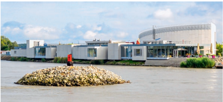
Das Danubiana Meulensteen Art Museum in Čunovo

Bekanntester Ort auf dem Abschnitt zwischen Bratislava und Komárno/Komárom ist Gabčíkovo, rund 20 Kilometer hinter Bratislava. Der Ort liegt vom Fluss entfernt und hat zudem keine historische Bedeutung; erwähnenswert ist er aber