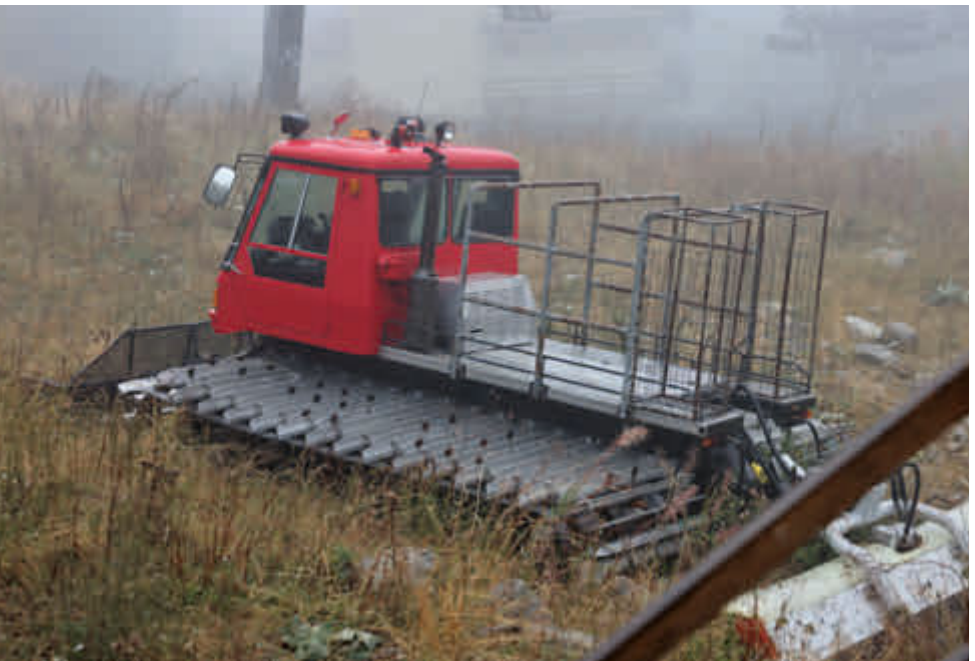
Brezovica, Kosovo – hier sind wir in den High Scardus Trail gestartet.