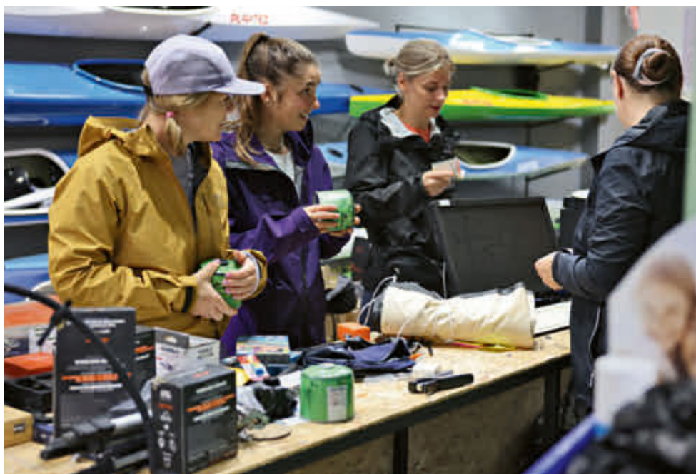
Auf der Suche nach Campinggas und Bärenspray in Pristina