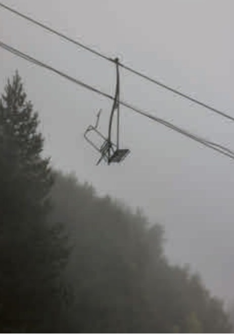
Brezovica ist das größte Skigebiet im Kosovo.