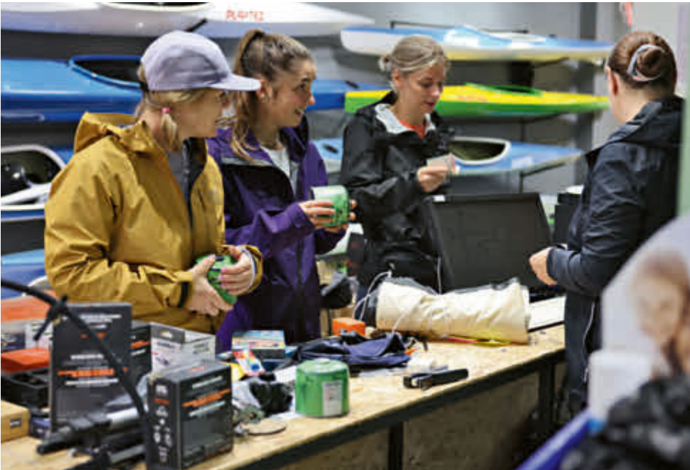
Auf der Suche nach Campinggas und Bärenspray in Pristina