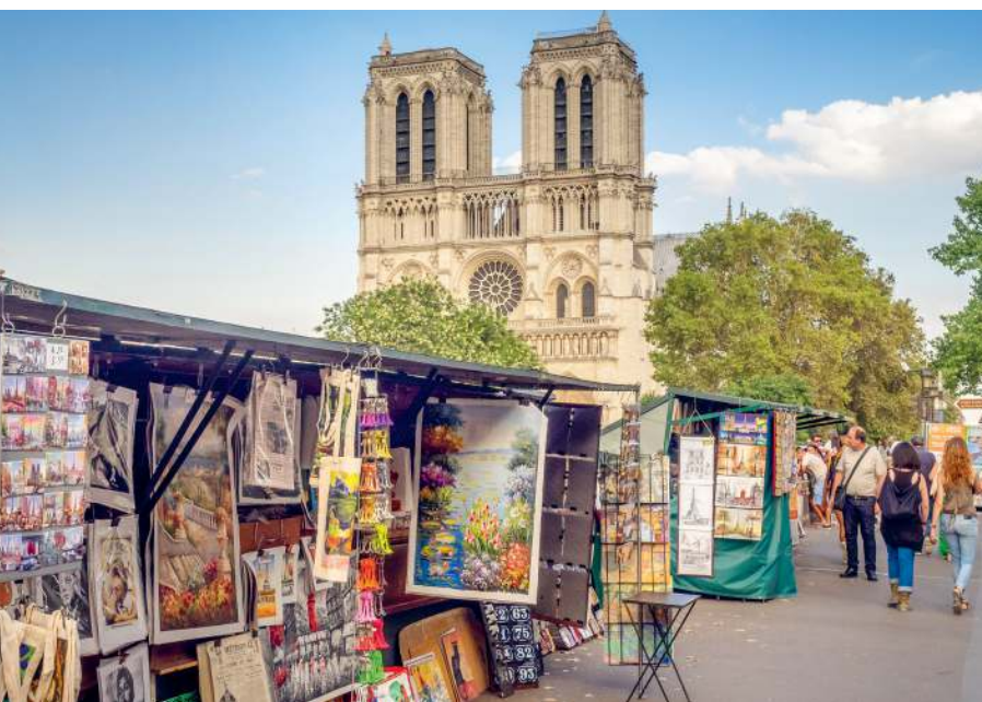
Bouquinisten an der Seine: ein gewaltiger Fundus an Büchern, Bildern, Plakaten ...