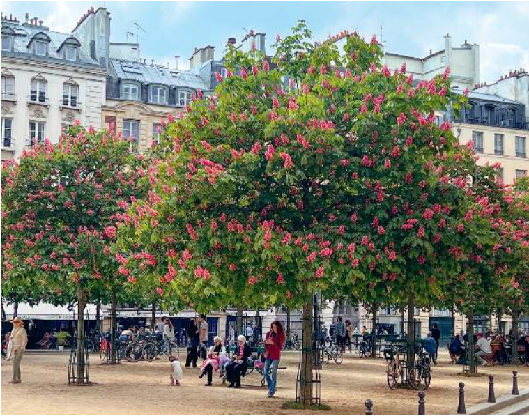
Von einer besonders schönen Seite zeigt sich die Place Dauphine im Frühjahr, wenn die Kastanien ihr rotes Blütenkleid angelegt haben.

Im Rücken des Justizpalastes liegt die Place Dauphine, ein dreieckiger Platz mit schönen alten Kastanienbäumen. Auf den Bänken lässt sich herrlich verweilen, auf der sandigen Platzmitte treffen sich alte Männer zum Boule-Spiel. Und es gibt einige sehr einladende Cafés und Restaurants rund um diesen einst königlichen Platz, den ich sehr mag. Er grenzt direkt an den Pont-Neuf, die neue Brücke, die trotz des irreführenden Namens die älteste Brücke der Stadt ist. Sie verbindet beide Uferseiten mit der Île de la Cité, die aufsehenerregenden Bögen prägen das Stadtbild bis heute. Auf der rechten Uferseite überragt das Kaufhaus La Samaritaine die Brücke, mit dem emblematischen Schriftzug auf der Fassade. Seit 1869 war es eines der größten Kaufhäuser der Stadt, bis es 2005 aus Gründen des Brandschutzes geschlossen wurde. Es dauerte fast zwei Jahrzehnte bis zur Wiedereröffnung, all die Jahre war dieses Haus in bester Lage verwaist. Doch im Jahr 2021 eröffnete der Luxuskonzern LVMH (zu dem Louis Vuitton, Hermès und andere gehören) das Kaufhaus neu – nun kann die Dachterrasse mit einem wunderbaren Blick