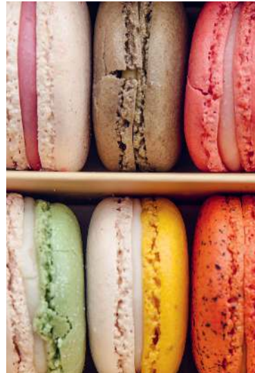
Zart und cremig: Macarons, ein Baisergebäck aus Mandelmehl