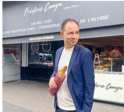
Zwei, die sich mögen: la baguette et moi