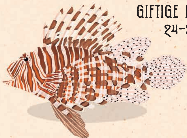
GIFTIGE FISCHE 24-25