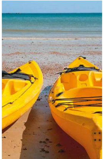
Ein Erlebnis: mit Kajaks die beliebte St. Brelade's Bay (► S. 48) erkunden.