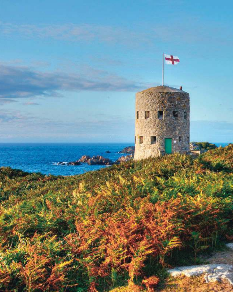
Tower No. 5 an der Pembroke Bay im Nordosten von Guernsey. Die Martello-Türme (► S. 104), Wach- und Wehrtürme aus dem 18. Jh., findet man entlang der Küste.