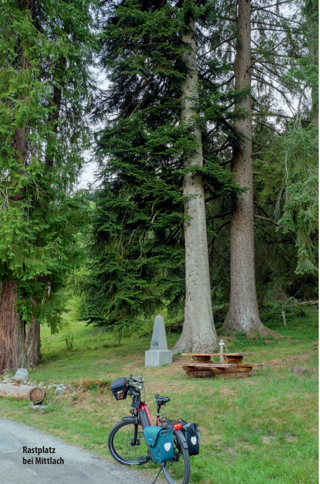
Rastplatz bei Mittlach