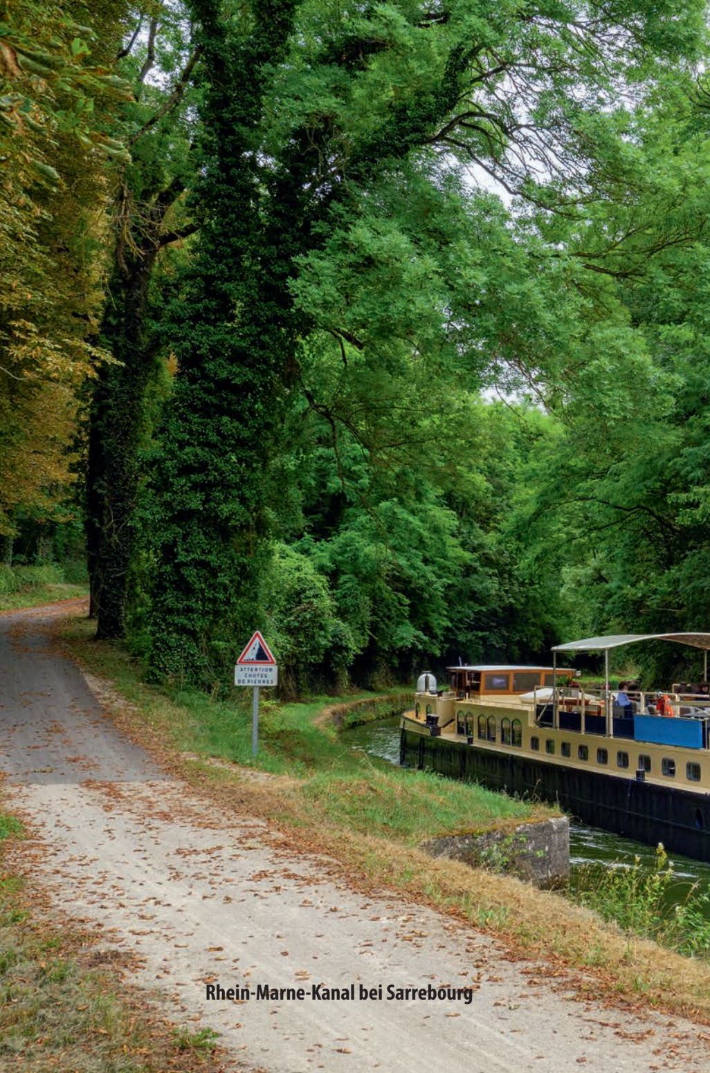
Rhein-Marne-Kanal bei Sarrebourg