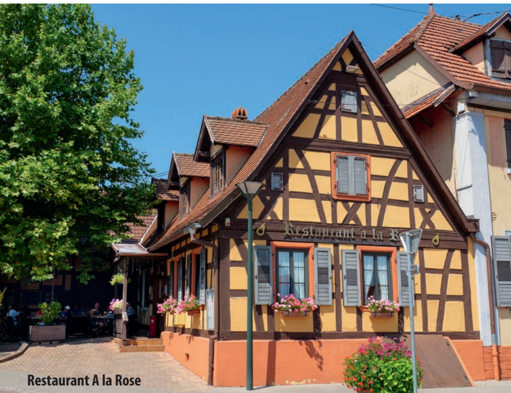
Restaurant A la Rose

Vor einem Umspannwerk überqueren wir die Rue de l'Ancienne Raffinerie mit einem Schlenker nach links