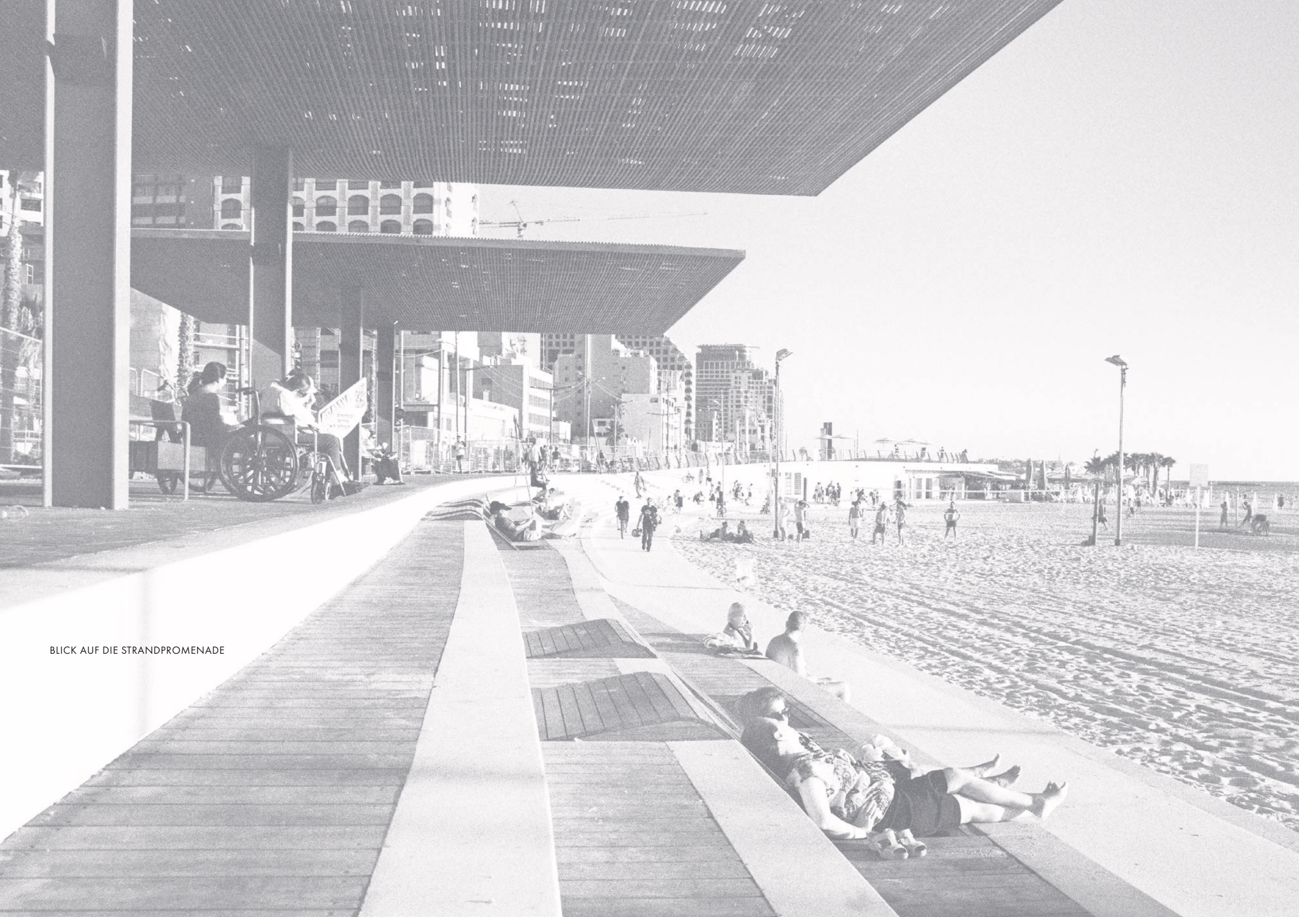
BLICK AUF DIE STRANDPROMENADE