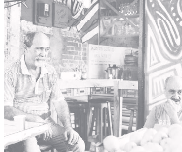
AUF DEM TRÖDEL- UND ANTIQUITÄTENMARKT IN YAFO

»Danach habe ich nicht gefragt. Also ...« Die Knopfaugen im Kugelkopf observieren dich, und du knallst ihm das rückseitig aufgeschlagene Notizbuch auf das Tischchen. Da sind die Adressen deiner Schriftsteller-Kollegen, will heißen deiner Vormitternachts-Freunde, denn die Namen deiner Club-Kumpels geht nun keine Security der Welt etwas an.