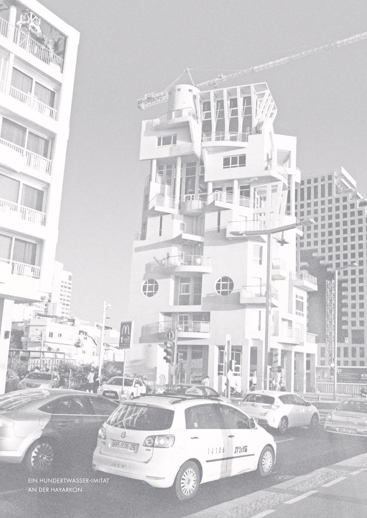
EIN HUNDERTWASSER-IMITAT AN DER HAYARKON