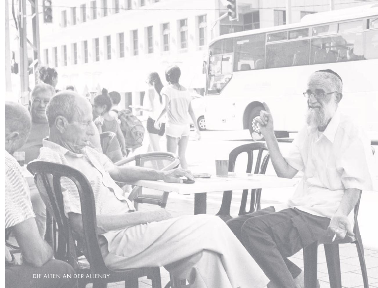
DIE ALTEN AN DER ALLENBY

Und hörtest umso aufmerksamer zu, als keine Gefahr drohte: Die Alten hatten ja längst begriffen, dass du hier höchstens eine an den Ecken eingeknickte Schwarz-Weiß-Postkarte kaufen würdest, die deine geliebte schmutzige Allenby Street noch als propere Kleinstadtstraße zeigte, und auf der Rückseite diese Aufschrift: Tel-Aviv bei Jaffa . Ha, wie sie sich an deiner Verblüffung weideten und dabei sogar vergaßen, den wenigen anderen Touristen dieses Sommers (der Schreck von Sadams Scud-Raketen steckte vor allem jenen noch in den Knochen, die nie von ihnen bedroht gewesen waren) ihren Krempel anzupreisen. Ha, macht doch gar nichts, dass der Junge kein Budget für Großeinkäufe hat, wenn wir ihn nur zum Staunen bringen und zum Kapiere, dass hier, im inzwischen zur Vorstadt abgesunkenen Yafo-alias-Jaffa, die historische Weltmusik gespielt hatte (lärmend und dem Ohr ein Graus wie immer, aber nu!) und nicht etwa da drüben in der Parvenü-Siedlung, von New-York- und Weimarer-Bauhaus-Epigonen in unziemlicher Hast in die Höhe gezogen, hybrides Schtetel das, während hier, my friend ,