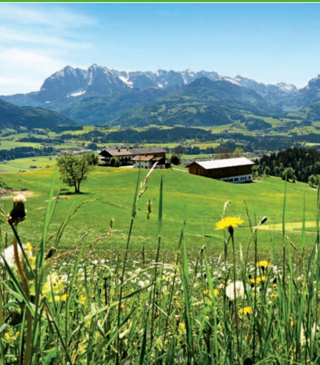
Frühling am Mühlberg oberhalb von Kössen mit Blick zum Kaisergebirge