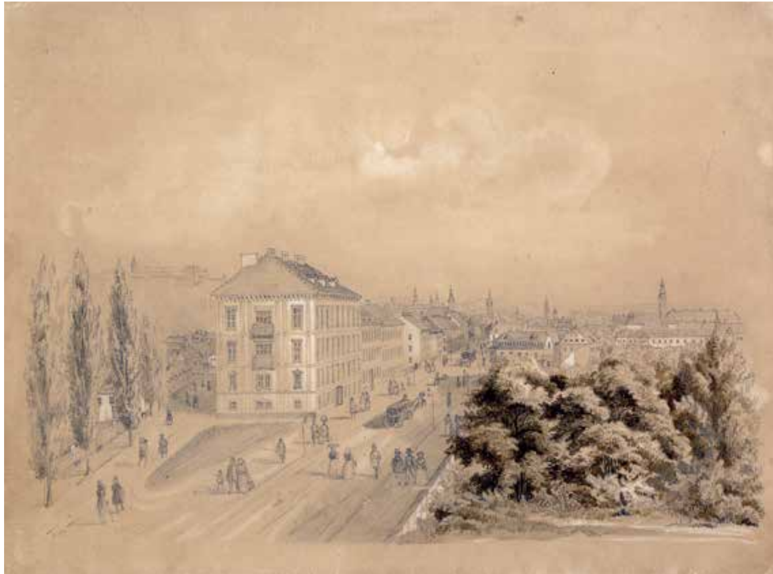
Blick vom Bahnhof in die Annenstraße, um 1850

den aus dem Krieg heimkehrenden siegreichen Feldherrn wieder den städtischen Gesetzen zu unterwerfen und von der Schuld der Kriegshandlungen reinzuwaschen. Ob diese Bedeutung — der Kaiser möge sich den hiesigen Regeln unterwerfen — bei der Errichtung des Grazer Triumphbogens angestrebt war, ist nicht überliefert.