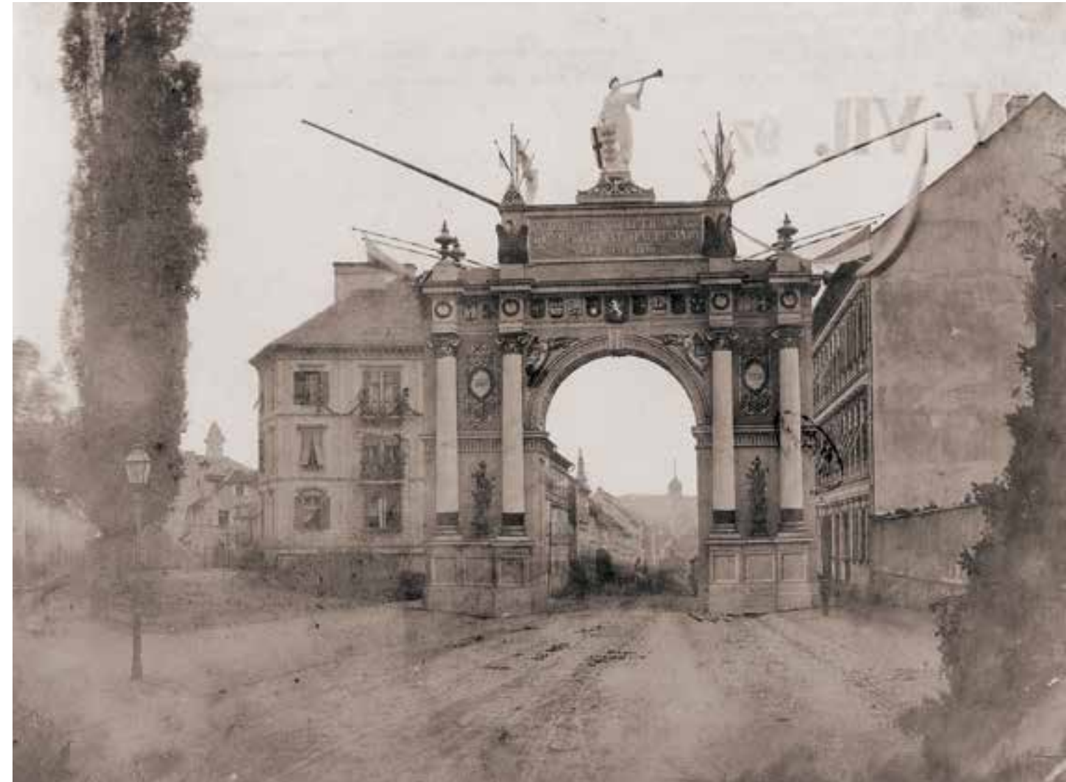
Triumphbogen aus Holz, 1856