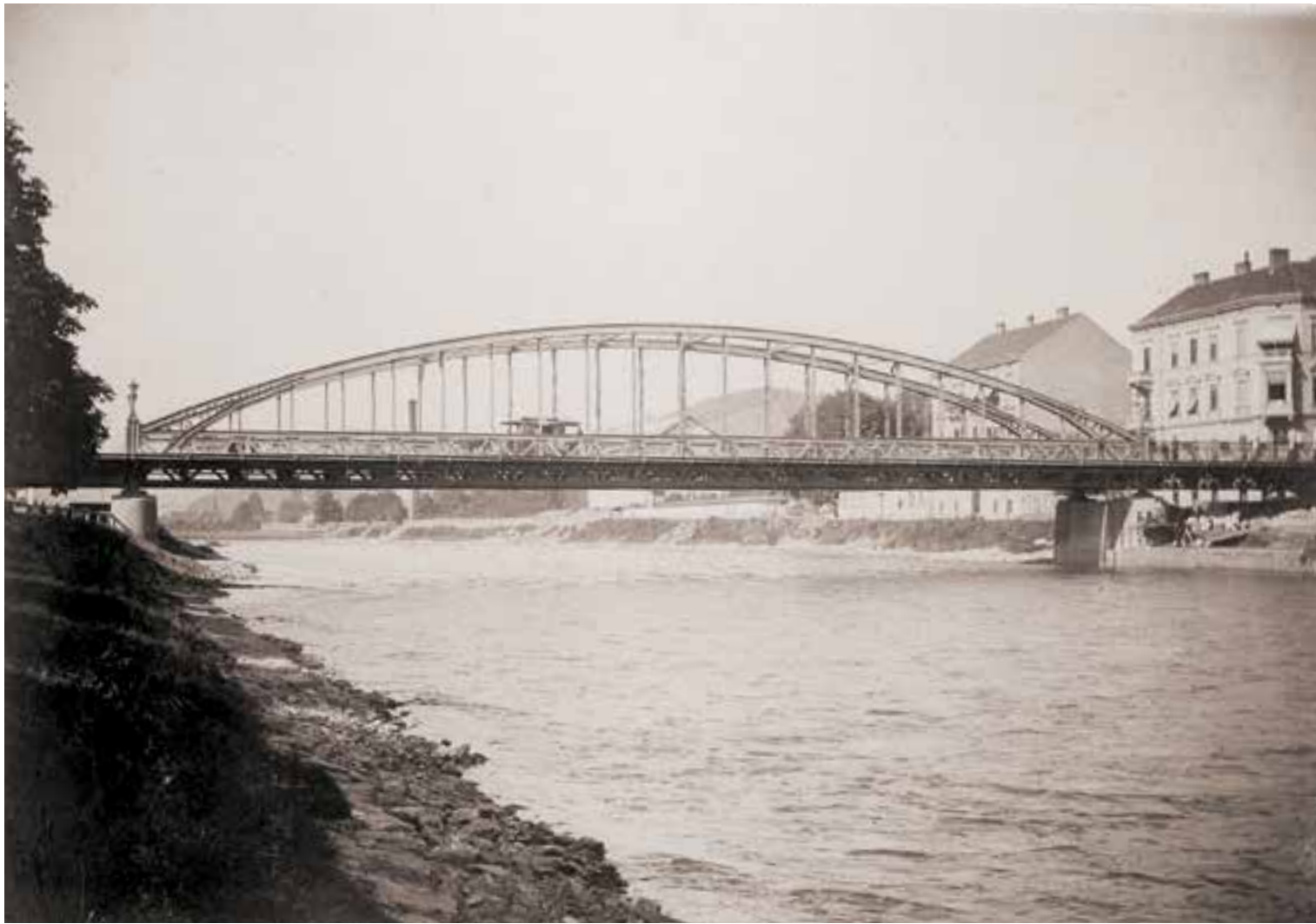
Neue Ferdinandsbrücke, um 1885