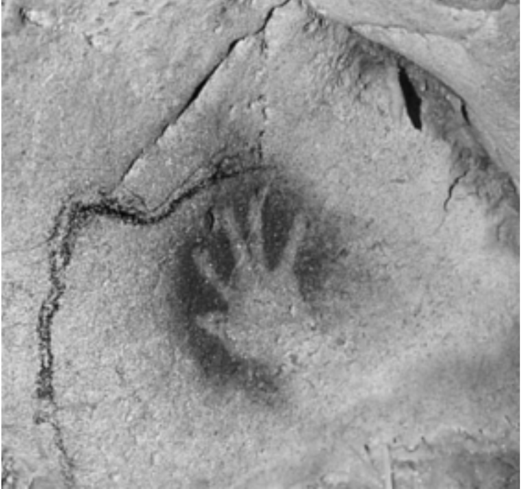
1. Abdruck einer menschlichen Hand in der Chauvet-Höhle in Südfrankreich. Diese Kunstwerke sind etwa 30 000 Jahre alt und wurden von Menschen hinterlassen, die aussahen, dachten und fühlten wie wir. Vielleicht wollte er oder sie sagen: »Ich war hier!«