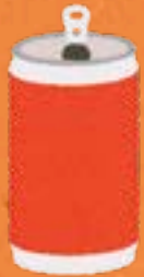
Getränkedose aus Alu 200 Jahre