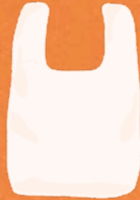
Plastiktüte 500 Jahre