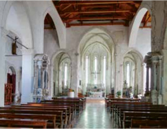
Dom in Venzone

Dome, die sie mit besonderem Ehrgeiz prunkvoll gestalten ließen. Der Reichtum, den die Zolleinnahmen brachten, war der Grund, warum die Besitzer von Venzone des Öfteren wechselten. Nach den Herren von Mels waren es die Herzöge von Kärnten, danach die Grafen von Görz und schließlich die Herzöge von Österreich, bis die Stadt 1420 unter die Herrschaft Venedigs kam, womit allerdings der wirtschaftliche Niedergang begann.