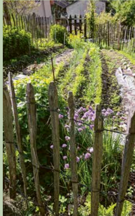
Obst und Gemüse im Hausgarten

Eine Küche, die aus den bescheidenen, aber unverfälschten Produkten in den Gebirgsregionen entstanden ist, in der schon in der Vergangenheit karnische Hausfrauen Gewürze, Trockenobst und orientalische Aromen zu ganz eigenen Zusammenstellungen kombinierten. Hat der alpine Bereich des Tagliamento und seiner Nebenflüsse eher bodenständige und deftige Rezepte zu bieten, so überwiegt die mediterrane Kochtradition in seinem Unterlauf, der großen Ebene. Während im Norden das Angebot an Fleisch auf dem Speiseplan größer ist, bevorzugt man, je weiter man nach Süden kommt, eher leichtere Kost mit Fischen und Meeresfrüchten. Gemeinsam ist allen eine Vorliebe für Nudelgerichte und die reichliche Verwendung von Gemüse und Salaten.