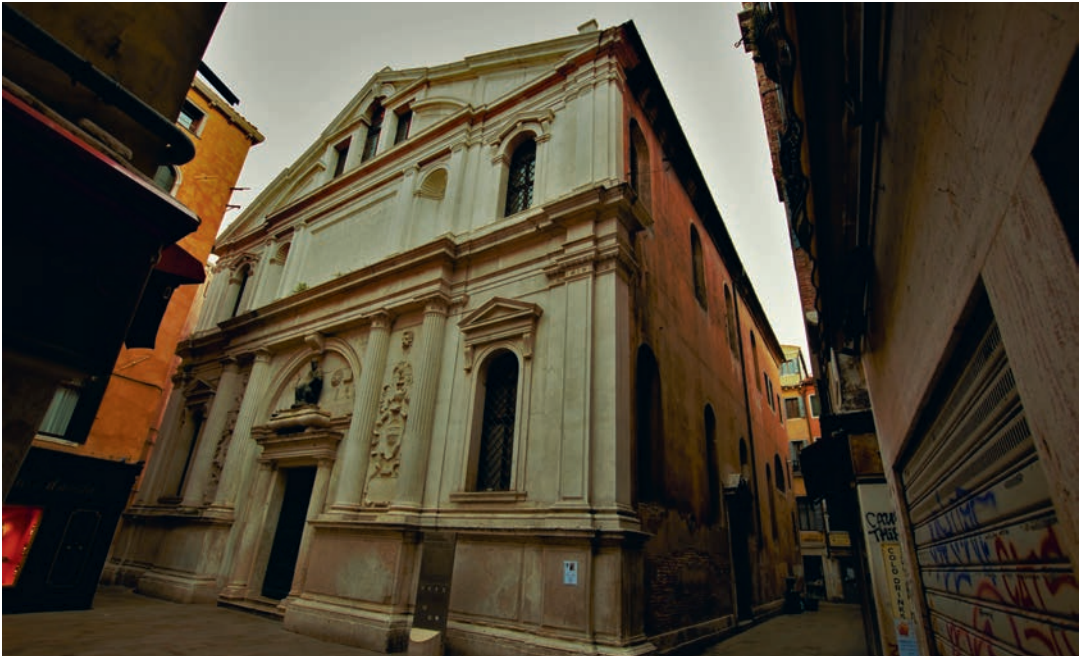
Die Fassade der Chiesa di San Zulian mit der Bronzeskulptur des narzisstischen Tomaso Rangone.