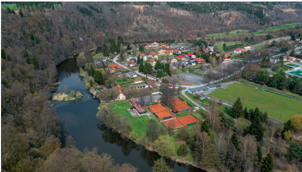
Abbildung 4: Flughöhe 120 m, ca. 150 m horizontale Entfernung zum Startpunkt