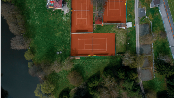
Abbildung 3: Flughöhe 120 m, senkrecht zum Startpunkt