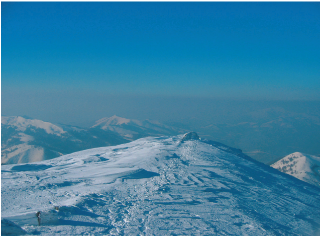
Cima del Adi.

do se termine, continuamos por un marcado camino que prosigue en la misma dirección (existen marcas de GR). Llegaremos a una puerta metálica (1.190 m, 40 min) , que debemos atravesar para alcanzar las amplias pendientes despejadas que ascienden a la