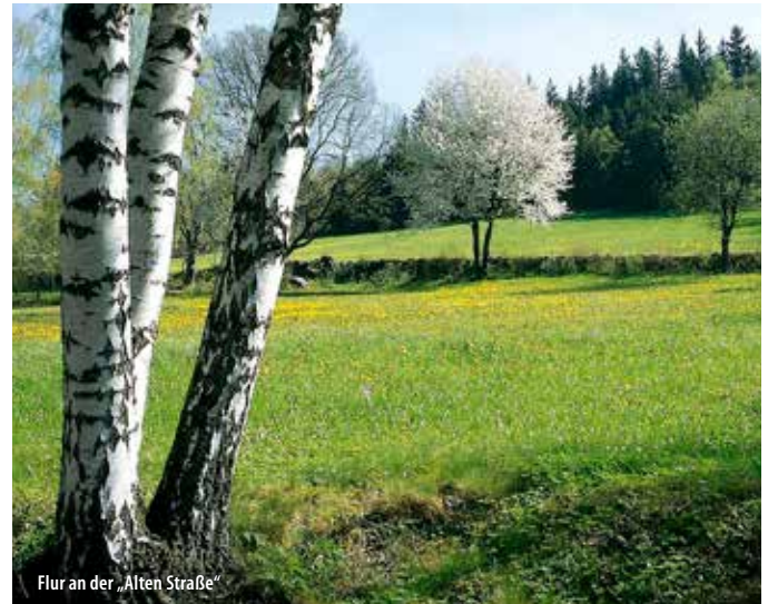
Flur an der „Alten Straße“

Hier links bis zur Kurve – aber nicht bis zur Hauptstraße und auch nicht die rechte Waldstraße benutzen! – sondern geradeaus am Waldrand mit roter Markierung weiter. Im weiteren Wegverlauf geht man an einem alten Gehöft vorbei in den Talgrund hinaus. Bei der Laimbachbrücke stellt links ein Asphaltweg die Verbindung zum Ausgangspunkt des Ostrong-Aufstieges her. Sonst hält man sich rechts über den Weiler Thaya nach Laimbach.