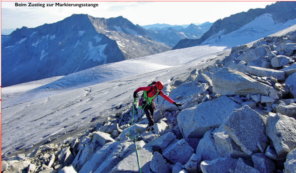
Beim Zustieg zur Markierungsstange

Anreise: Von Neukirchen am Großvenediger in das Obersulzbachtal zum Parkplatz Hopfeldboden, von dort zur Kürsingerhütte (Hüttentaxi). Öffis: Mit dem Bus nach Neukirchen, weiter mit dem Taxibus zur Materialeilbahn.