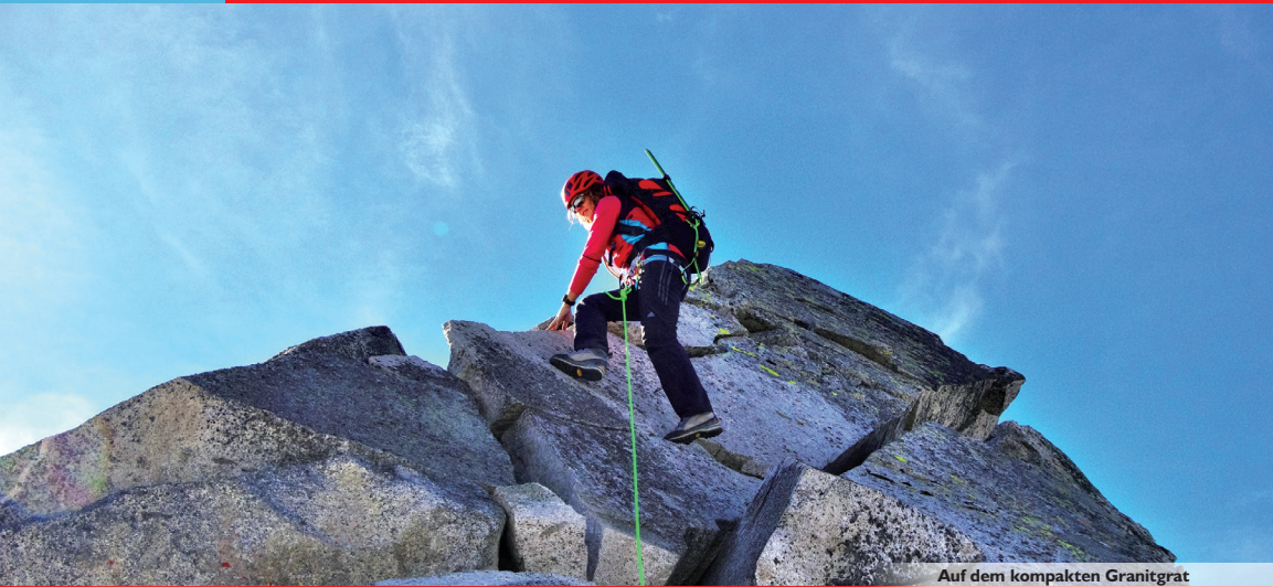
Auf dem kompakten Granitgrat