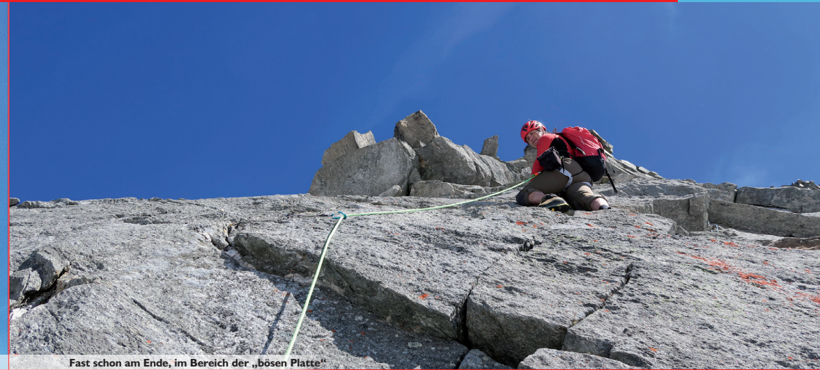
Fast schon am Ende, im Bereich der „bösen Platte“