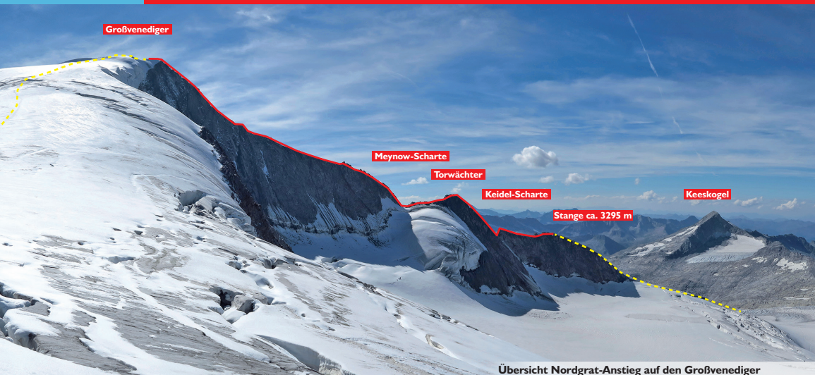
Übersicht Nordgrat-Anstieg auf den Großvenediger

zu einem weiteren Haken. Die kleinen Stufen rechts muss man links umgehen, dann folgt leichteres Gelände. Zuletzt auf dem leichten Blockgrat bis zum Gipfel.