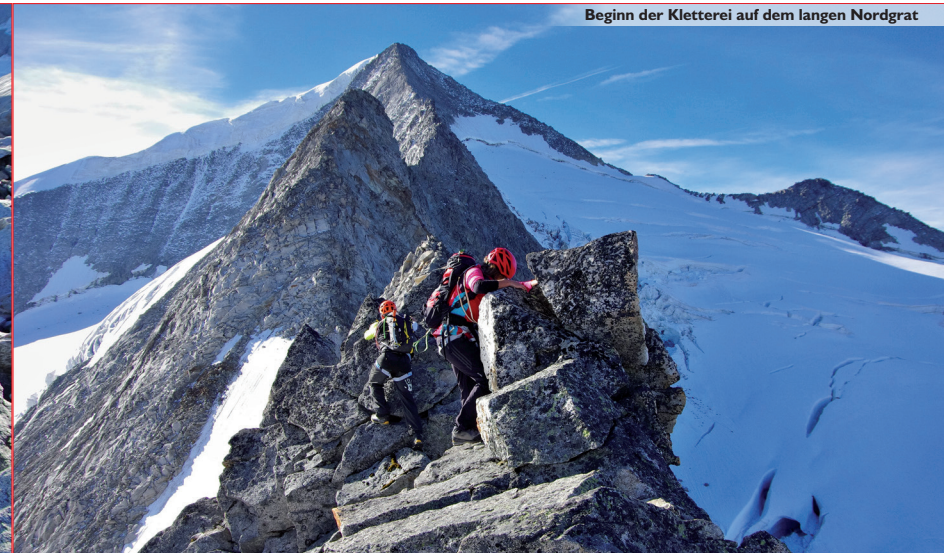
Beginn der Kletterei auf dem langen Nordgrat

Route: Siehe Topo. Man überklettert den ersten Aufschwung (anfangs 3, dann 2- und 1-2) und gelangt in die kleine Keidel-Scharte. Von dort auf dem Grat zum Torwächter (3465 m). Vom „Gipfel“ einfach hinunter zur Meynow-Scharte. Links vom Grat länger steil hinauf (2-3, dann leichter). Die Schlüsselpassage beginnt mit einem breiten Riss, danach leicht rechtshaltend zu einem roten Normalhaken. Von diesem links hinauf