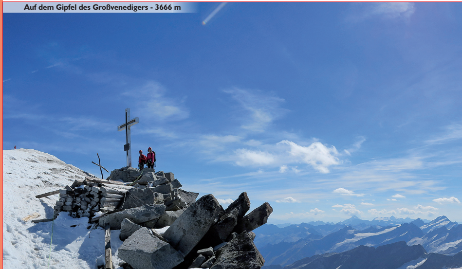
Auf dem Gipfel des Großvenedigers - 3666 m

Bemerkung: Der Abstieg auf dem Normalweg ist nach der Venedigerscharte kurz steil und sehr spaltenreich - Hochtourenenerfahrung nötig!