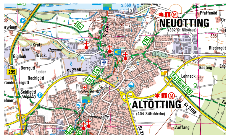
Ausschnitt aus UK50-44 Inn-Salzach-Region - Rupertiwinkel - Östlicher Chiemgau

Am Chiemsee kann man bei Seebruck an zahlreichen Orten in die Kelten- und Römerzeit abtauchen. Die neuen Themenradwege erschließen diese und weitere regionale Sehenswürdigkeiten. Ganz im Süden der Karte verspricht die „Lokwelt Freilassing“ oder das „Traumwerk“ in Anger für Jung und Alt ein Freizeiterlebnis der besonderen Art.