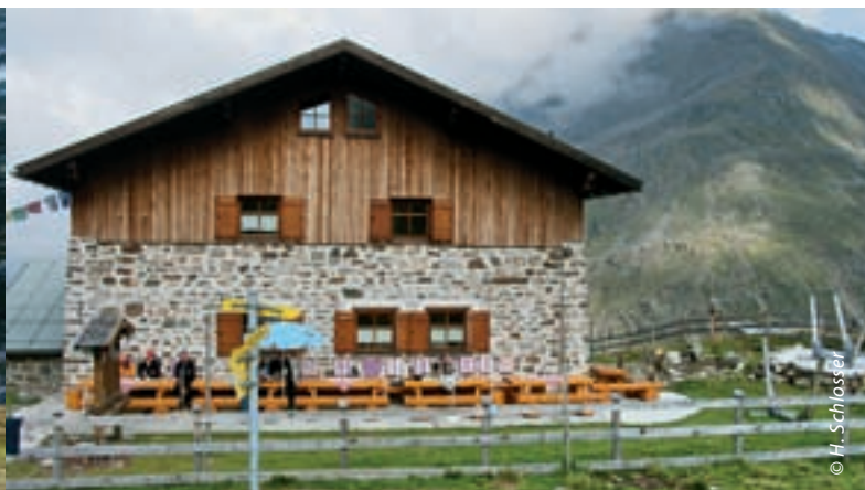
Die Potsdamer Hütte (links) und die Pforzheimer Hütte (rechts) sind die alpinen Unterkünfte im Fotscher bzw. Gleirschtal. Sie sind Ausgangspunkt zu Wanderungen und hochalpinen Touren sowie (mit dem Westfalenhaus) Etappenziele der Sellraintaler Hüttenrunde.

des Gleirsch- und Kraspestals bestiegen hat. Über den 1937 verstorbenen Adolf Witzemann ist allerdings auch zu erwähnen, dass er als Mitglied des Hauptausschusses dazu beitrug, den Alpenverein im nationalsozialistischen Gedankengut auf- und damit untergehen zu lassen. Im Unterschied zu vielen anderen AV-Hütten waren die drei im Sellrain während des Zweiten Weltkriegs fast durchgehend bewirtschaftet. Genutzt wurden die Hütten primär für Erholungsurlaube von Frontsoldaten und die paramilitärische Ausbildung der Hitlerjugend.